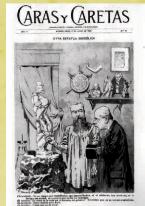
Facsimil de Caras y Caretas

sátira política y poco a poco fue convirtiéndose en una revista de interés general la que fuera publicada entre 1904 y 1918 llamada PBT . Todas con un estilo de redacción y de dibujos muy parecidos, y con el objetivo de hacer notar las falencias de los personajes en su faz humana y política. O simplemente sacaban a la luz secretos de los referentes sociales de aquella época.