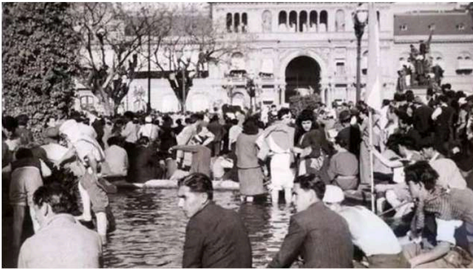
Las "patas en la fuente" en la marcha para pedir la liberación de Perón, el 17 de octubre de 1945