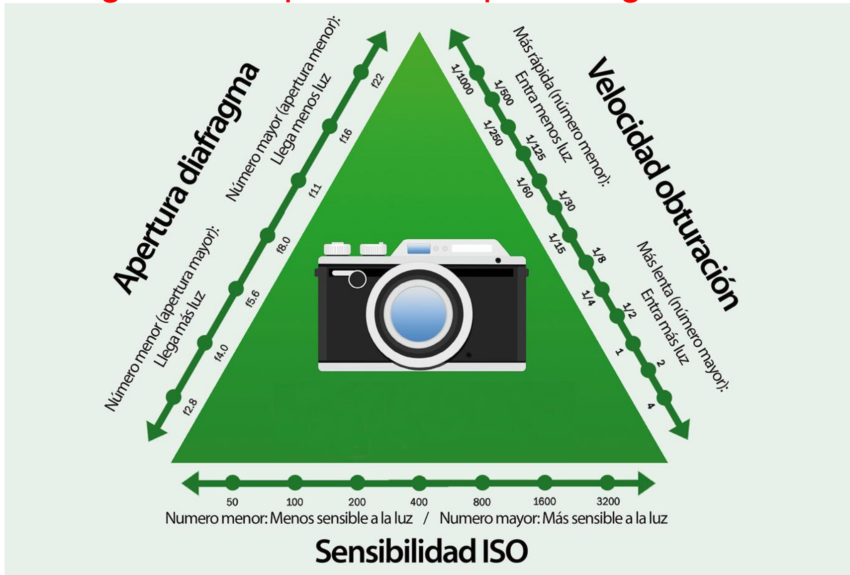
Triángulo básico de exposición mostrando su significado de la forma más gráfica posible.