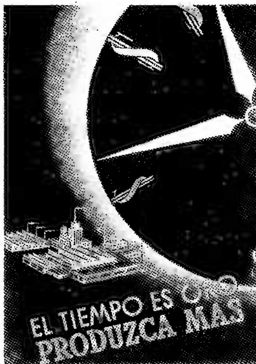
Propaganda oficial instando a producir más.

A fines de 1954 el gobierno se hizo eco de la demanda de los empresarios y convocó a una asamblea tripartita para discutir los problemas de la productividad. Con ello calculó mal su