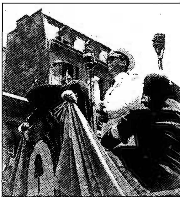
Habla el coronel Perón en el primer aniversario de la Secretaría de Trabajo, 26-11-1944.

Para ponerla en marcha trató de dissociarse de las medidas represivas del régimen e inició contactos con dirigentes de los principales gremios, a los que invitó a que nombraran asesores con el fin de hacer una revisión exhaustiva de las quejas presentadas a