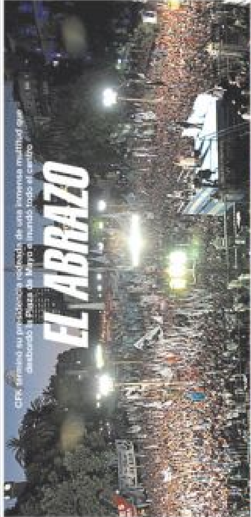
CFE, cerró su producción rotaria de una jamonera multitud que cubrió el Plaza de Mayo e invadió todo el centro