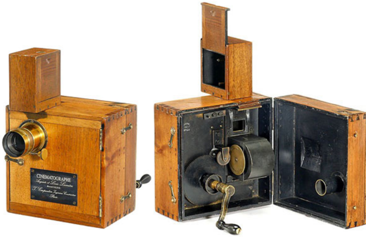
La maravilla del cinematógrafo

Lumiere). Realmente para 1894 era una novedad. Miremos un poco https://www.youtube.com/watch?v=QMK-TDZc70w Miren todo, no sean fiacas que todavía estamos en cuarentena, o reclusos para no enfermarnos.