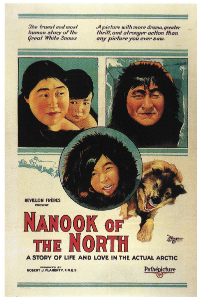
Afiche original de la peli

experiencia cotidiana así como desde el interior de las imágenes” . Me gustan mucho estas palabras de Jean Breschand.