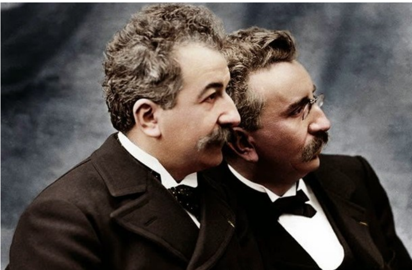
Los brothers Lumiere más grandecitos y llenitos de platita.

Despejada la depresión que me oprimió hace unos instantes vamos a pasar a repasar los orígenes del cine documental y como esas influencias todavía demarcan el presente del género. Si hilamos fino deberíamos decir que los hermanos Augusto y Luis Lumiere estrenan su cinematógrafo en el año 1894, y con su invento realmente la rompen. La fotografía había dado pasos gigantes para fines del siglo, y aunque el norteamericano Thomas Edison ya tenía su Kinestoscopio (un aparato con muchas similitudes que el de los Lumiere, pero que podía utilizar individualmente, una especie de netflix casero) el invento francés logró mayor popularidad, entre muchas razones porque se podía proyectar masivamente. Los hermanos Lumiere eran hijos de un importante empresario de la fotografía, y su invento, el cinematógrafo, era la expresión de una burguesía en su apogeo que se representaba a sí mismo y a su dominio del mundo.