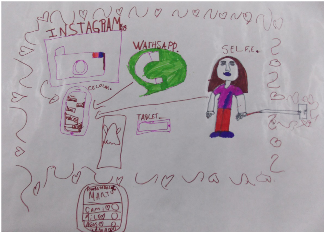
Imagen 2. Grupo focal, nenes, escuela privada, región Centro