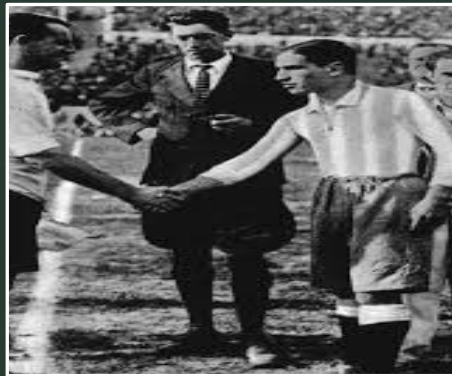
1871 figura del árbitro