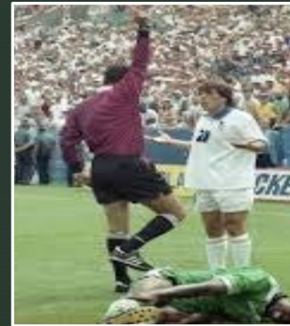
1994 casacas de colores