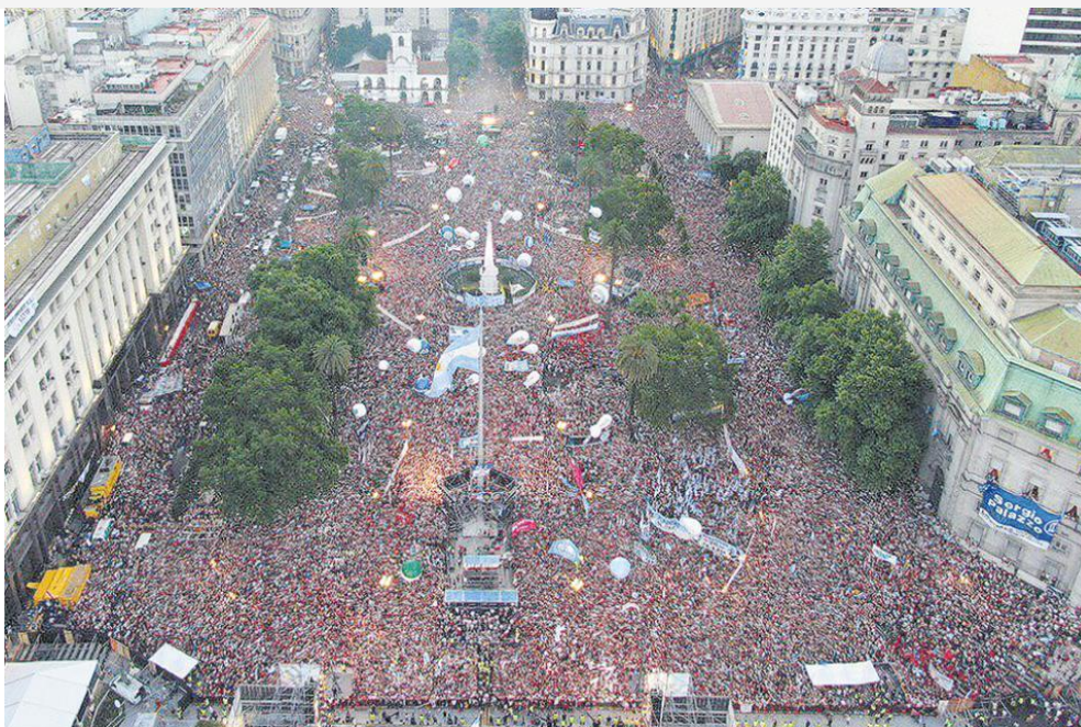
Cristina Kirchner y Alberto Fernández en el cierre en Plaza de Mayo.