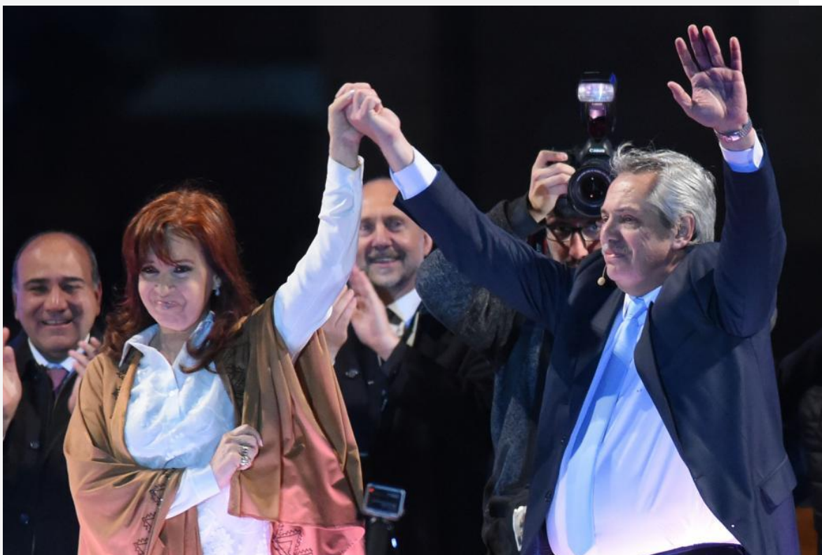
Cristina Kirchner y Alberto Fernández cerraán la jornada en la Plaza de Mayo.