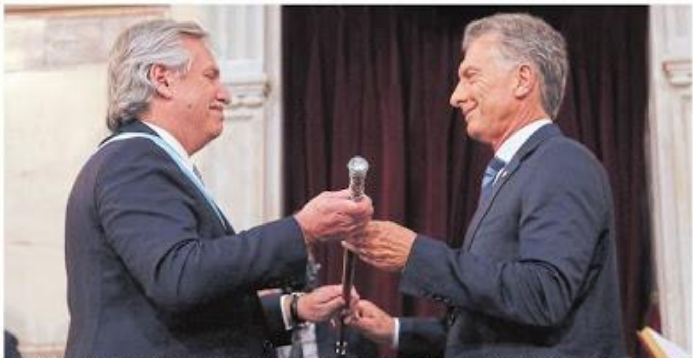
Momento histórico con gestos raros de cordialidad: Mauricio Macri le entrega el bastón presidencial a Alberto Fernández frente a la Asamblea Legislativa

Al asumir la presidencia, trazó un duro diagnóstico de la situación económica e insistió en que el país está en "default virtual"; prometió enfocarse en los más perjudicados por la crisis y dispuso intervenir la AFJ