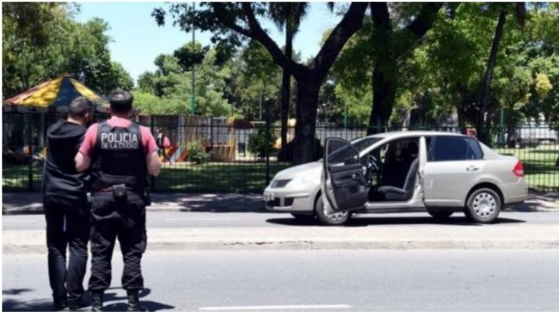
Los tres agentes de la Brigada de la Policía de la Ciudad se movían en un Nissan Tiida.