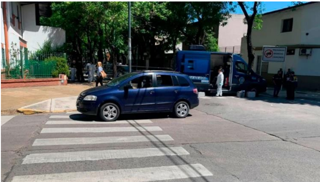
El Volkswagen Surán en el que viajaban los chicos: dos están detenidos y uno herido en la cabeza de un balazo