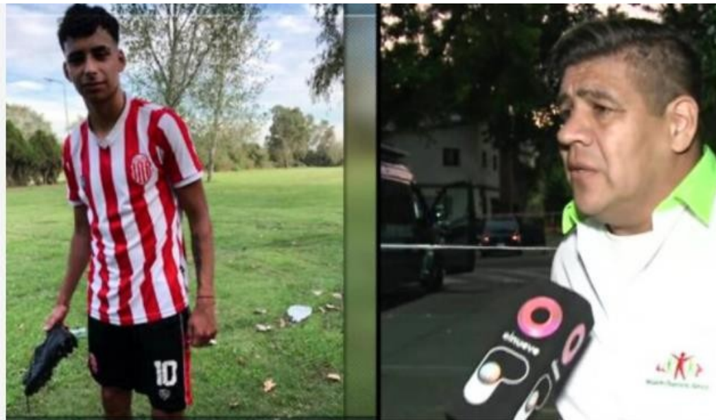
Cuatro jóvenes de 17 años fueron baleados en Barracas por policías de la Ciudad.

Fueron interceptados aparentemente por policías sin identificación y escaparon porque creyeron que se trataba de un robo. En ese momento les dispararon. La fuerza de seguridad dice haber encontrado un arma de juguete en el auto en el que estaban.