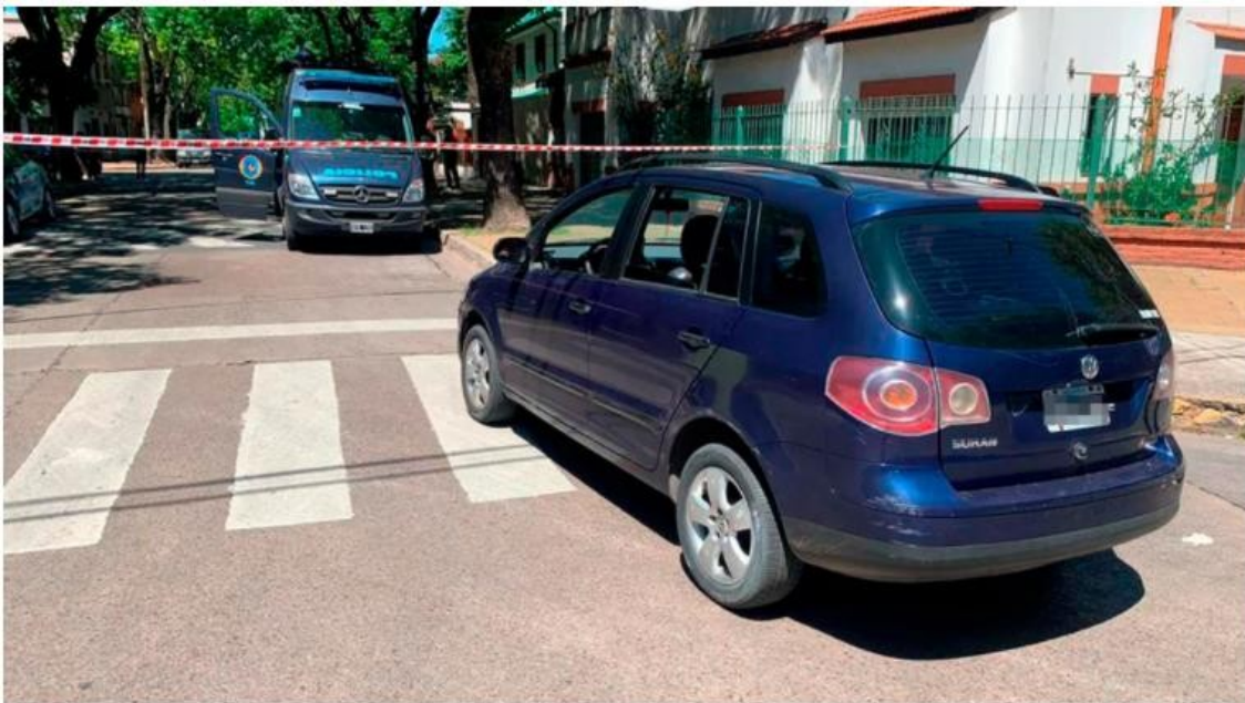
En el lugar donde se sucedieron los hechos trabajan agentes de la Policía Federal