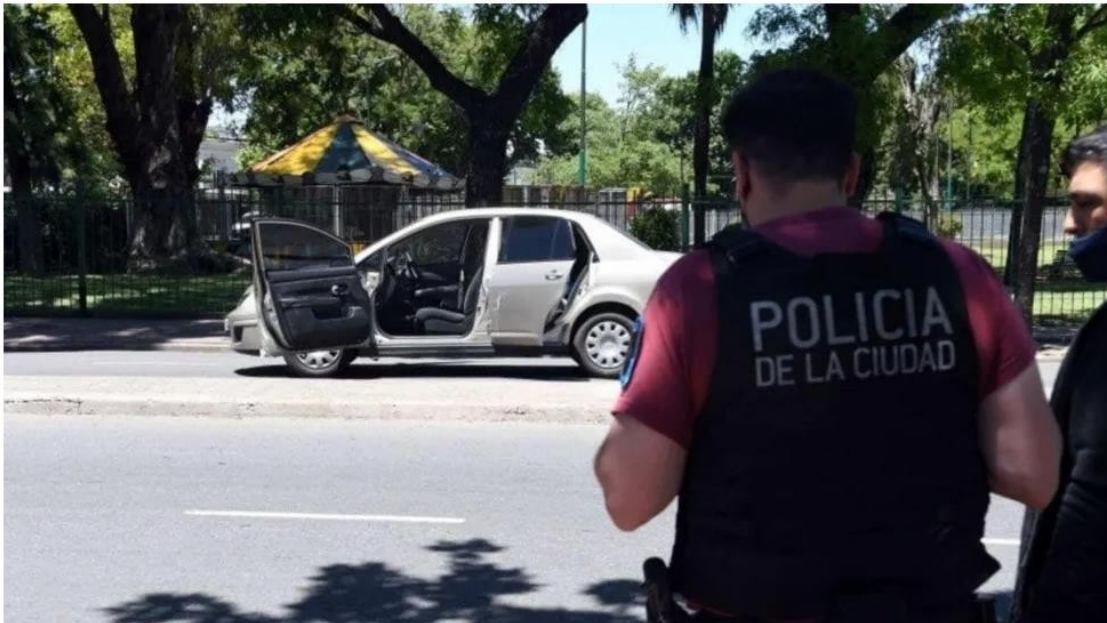
Los efectivos circulaban en un móvil no identificable, un Nissan Tiida color champagne.

El hecho ocurrió en la Ciudad de Buenos Aires. Intervinieron agentes de la fuerza de seguridad porteña. Por el caso encuadrado como averiguación de ilícito, fueron detenidos dos adolescentes y un tercero se entregó en una comisaría. La Justicia encargó las pericias a la Federal.