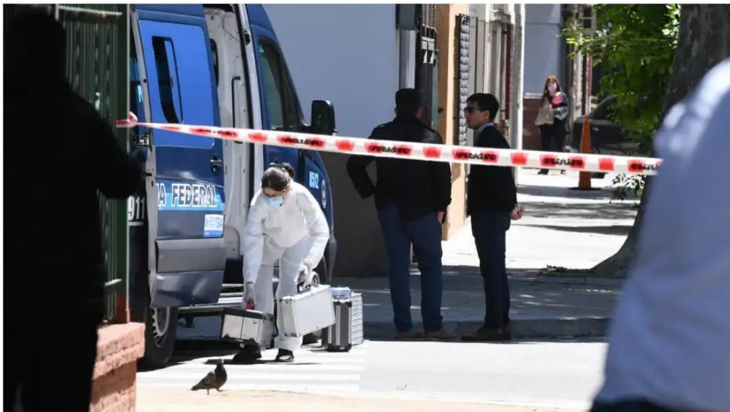
TIROTEO EN BARRACAS ALVARADO Y MEANA

Cuatro presuntos delincuentes se tirotearon con efectivos de la Policía de la Ciudad en el barrio porteño de Barracas y uno de ellos fue herido de un balazo en la cabeza, dos resultaron detenidos ilesos y el cuarto escapó.