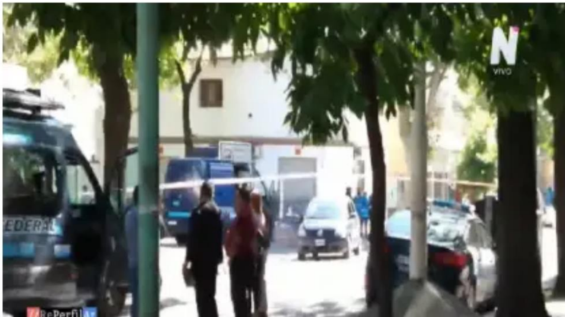
Barracas: tres detenidos tras una persecución y tiroteo con la policía | NET TV

El hecho ocurrió en la calle Luzuriaga, cuando policías de la Comisaría C4 porteña interceptaron y persiguieron a delincuentes en medio de un tiroteo.