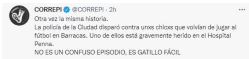
El descargo de la CORREPI.