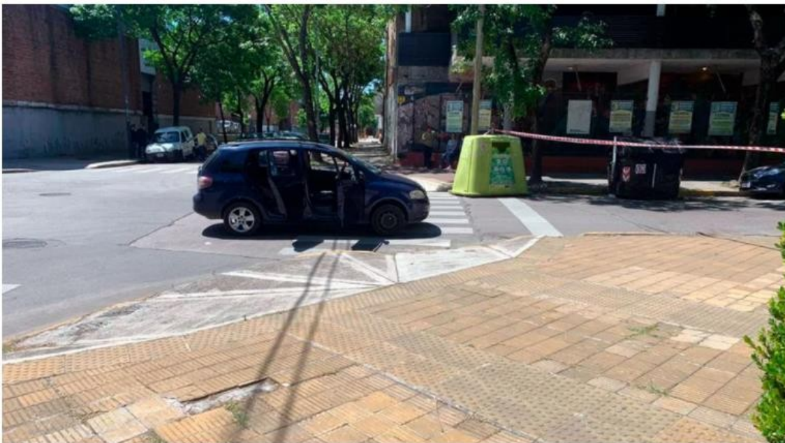
Así quedó el vehículo en el que iban los adolescentes tras la persecución