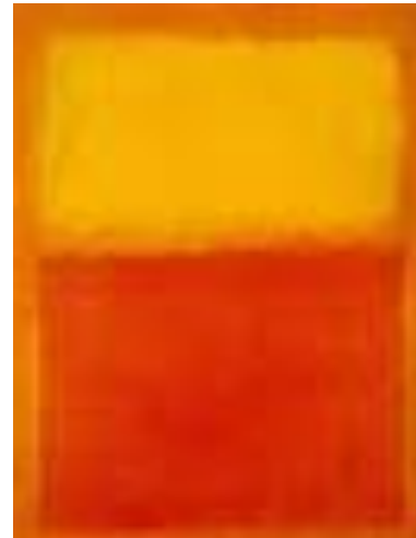
Sin titulo M Rothko