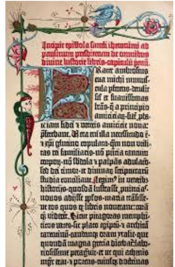
Biblia Gutenberg 1450