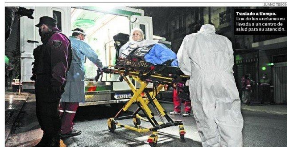
Tratado a tiempo. Una de las ancianas es llevada a un centro de salud para su atención.

Presos y coronavirus: al final, ¿en qué quedamos? p. 2