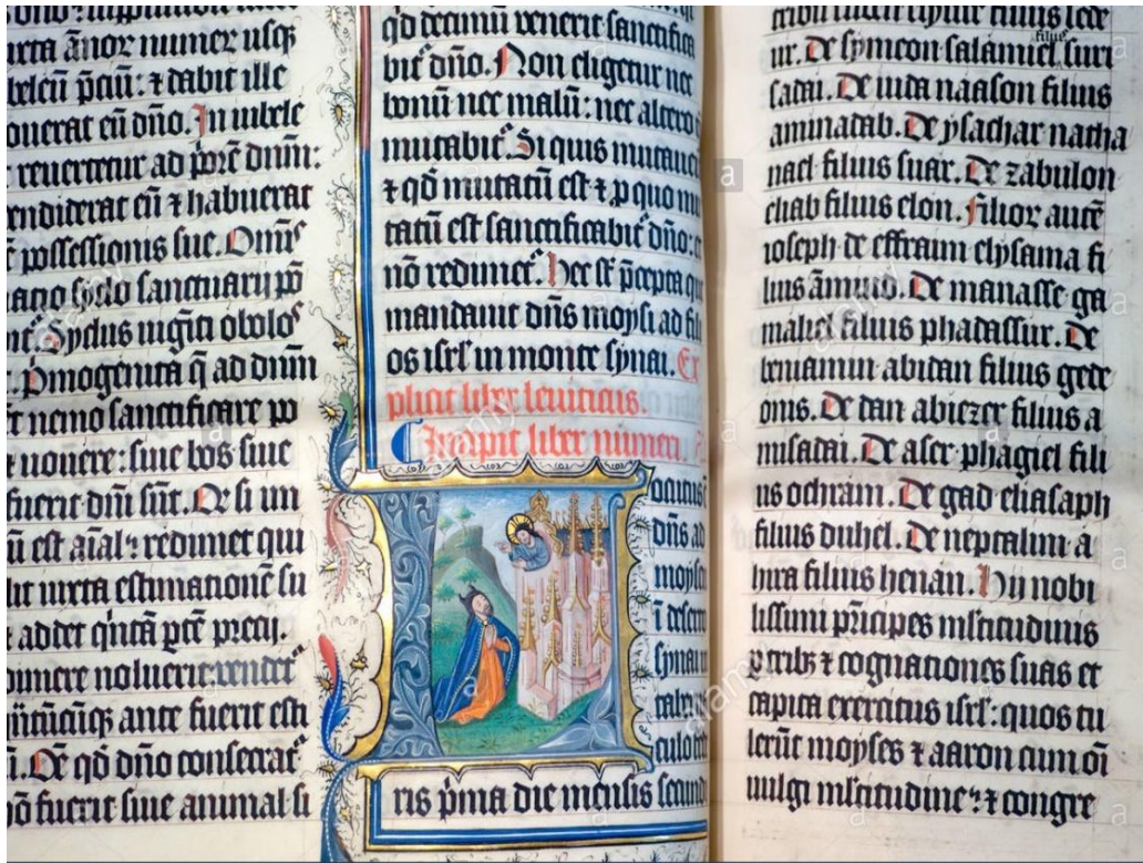
Biblia manuscrito 1407

Dispositivo gráfico: Palabra impresa - la página: “superficie rectangular que contiene una limitada cantidad de información, diseñada para acceder a ella en un cierto orden, y que tiene una relación determinada con otras páginas”