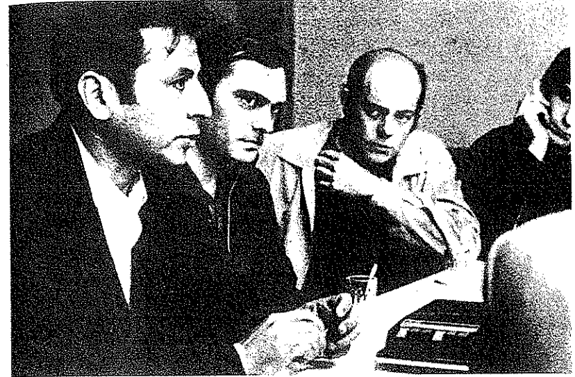
Dirigencia del PRT-ERP: Santucho, Gorriarán Merlo y Molina.

El 13 de septiembre, la presidenta delega el mando por razones de salud, pasando a residir, desde el día 14, en la localidad de Ascochinga, en compañía de las esposas de los comandantes del Ejército, Marina y Aeronáutica. La reemplaza el presidente del Senado, Ítalo Argentino Luder.