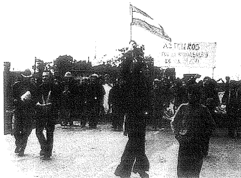
Mobilización de la CGT contra la política económica de Celestino Rodrigo.

provoca, bajo la presión de los trabajadores, la firma de convenios con aumentos salariales de más del 100%. Pero el ministro Rodrigo intenta establecer un máximo del 45% para dichos aumentos. En ausencia del jefe de "las 62" (Lorenzo Miguel) y del Secretario General de la CGT (Casildo Herrera), los gremialistas deciden, el día 26 de junio, un paro parcial con concurrencia a la Plaza de Mayo -para el día 27- en apoyo a la presidenta pero en contra de la política económica.