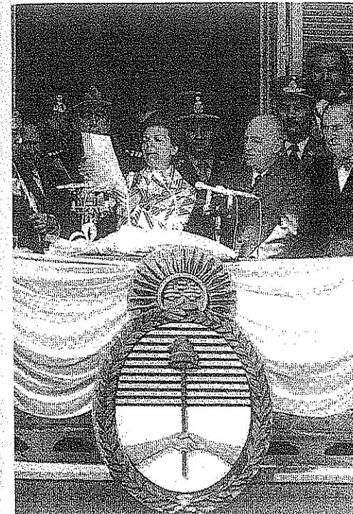
Isabel Perón en el balcón de la Casa Rosada, el 17 de octubre de 1974.