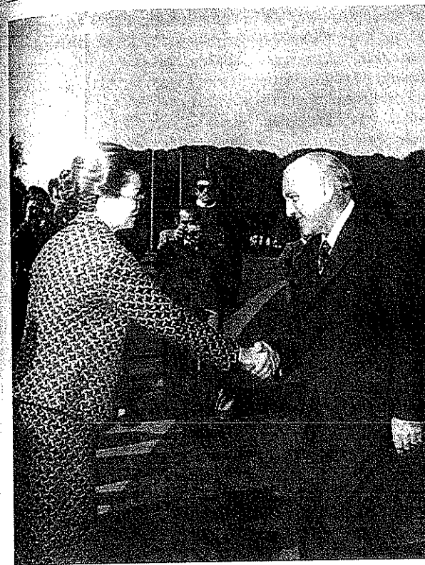
Isabel Perón estrecha la mano de López Rega, fundador de la Triple A e importantísimo colaborador de su gobierno.

función ciñéndose a sus directivas, pero fallecido Perón necesitaba imprescindiblemente la asistencia de alguien o algunos que tuvieran conocimiento, tanto de las complejas cuestiones del peronismo, como de la oposición y de los graves problemas del país. Esa función la ejerció inmediatamente José López Rega.