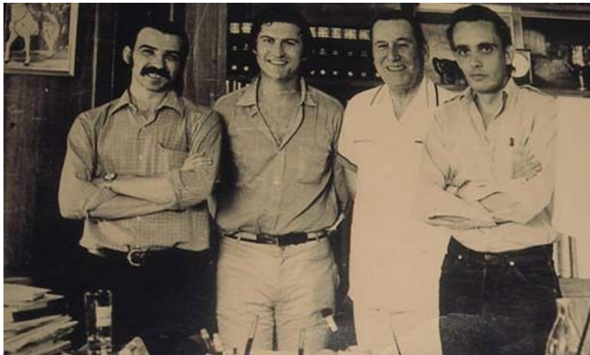
Gerardo Vallejo, Fernando Pino Solanas, Juan Perón y Octavio Getino, en Madrid durante el rodaje de "Perón, La revolución justicialista"

Cuando decimos que es un film de agitación debemos contextualizar la dedada de los 60: es la etapa de des-colonización del tercer mundo (África, América latina, Asia), es decir las colonias comienzan a buscar su intendencia y a erigirse como países soberanos. Era en un mundo bi polar de guerra fría donde Los EEUU y la URSS se disputaba el planeta; la revolución cubana había dejado huellas muy grandes en los países del tercer mundo. La guerra de Vietnam era un ejemplo de imperialismo por parte de Norteamérica. En este contexto, la argentina estaba en procesos de dictaduras o falsas democracias, con la proscripción del movimiento peronista hacía ya 10 años. Un marco efervescente para una película explosiva.