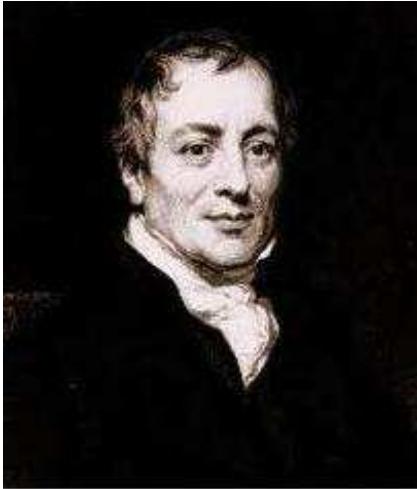
David Ricardo 1772- 1823

Malthus, Say y Ricardo revolucionaron el método económico, aunque la contribución de Ricardo fue en este terreno la más importante. La participación de Ricardo en el desarrollo del método de análisis puramente especulativo fue, con mucho, la mayor. Se puede decir que fue el fundador de la teoría económica pura como un ejercicio de lógica casi autónomo. Ricardo descubrió las leyes que gobiernan la distribución del producto en un modelo simple y abstracto.