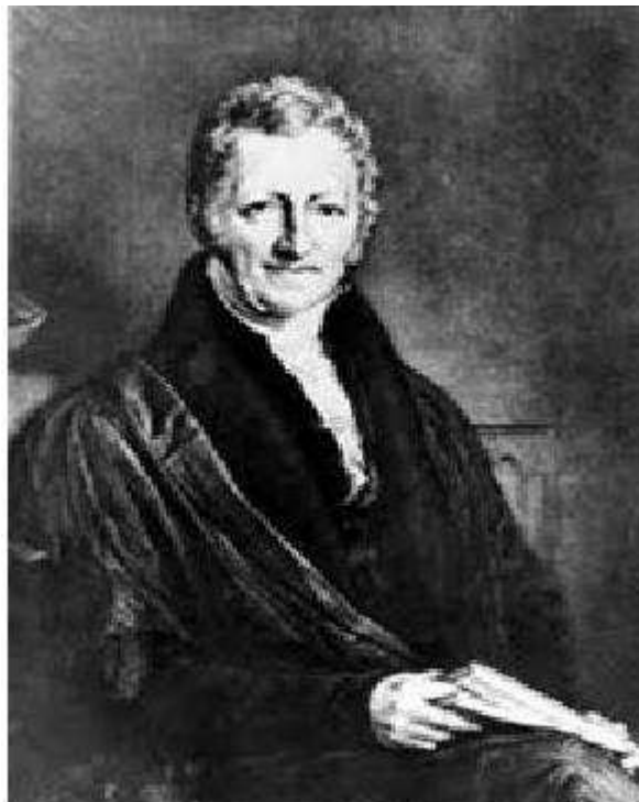
Thomas Malthus 1766-1834

Malthus, además de este principio de la población, formuló la ley de los rendimientos decrecientes de la tierra . Esta ley fue presentada casi simultáneamente, en el curso de veintiún días, en febrero de 1815, por no menos de cuatro destacados economistas ingleses: Malthus, West, Ricardo y Torrens. El hecho de esta coincidencia se debió a que la Cámara de los Lores y la de los Comunes habían nombrado comisiones para investigar las causas del alto precio del trigo durante los veinte años anteriores y de las altas rentas, hecho muy importante, que se pagaban por las tierras. Los terratenientes defendían la situación afirmando que la mejora del cultivo exigía cada vez más la roturación de tierras más pobres, cuya renta era muy baja a pesar del alto precio del trigo. Una