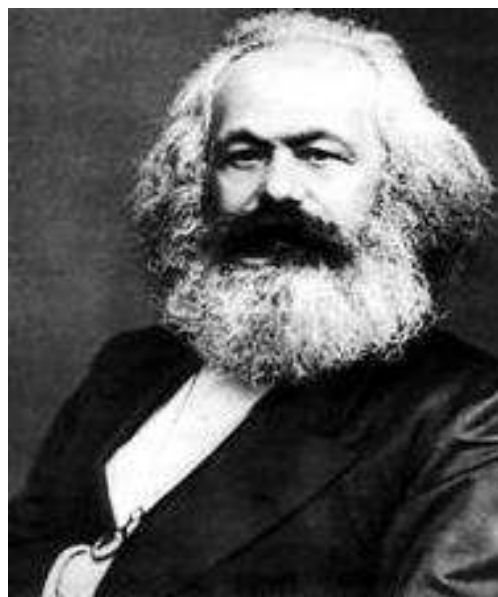
Karl Marx 1818-1883

Marx heredó mucho de la visión y estructura teórica de los clásicos, y de hecho hay quien le considera como el último de los economistas clásicos. No obstante, su análisis supuso una ruptura con su esquema teórico. En primer lugar, porque las leyes económicas que intentó descubrir no eran ni universales ni eternas, sino válidas para estadios particulares de la historia. Los economistas clásicos, en una línea que descendía directamente del pensamiento fisiócrata, aceptaron la sociedad en que vivieron como una parte del orden de la naturaleza. Marx, por el contrario, la consideró como una fase de transición entre el pasado feudal y el socialismo venidero. Lo que resulta significativo en El capital , es su fundamento esencialmente histórico: el objeto de análisis es el funcionamiento del capitalismo como sistema económico-social ligado a determinadas condiciones históricas, que lo caracterizan como un modo de producción específico. Esta última categoría comprende las relaciones sociales de producción: el aspecto fundamental del capitalismo que Marx pretendía develar era la polarización social, en virtud de la cual la propiedad tendía a concentrarse en manos de una minoría (la burguesía), mientras que la mayoría de la población (o una parte considerable de la misma) se veía totalmente privada de ella.