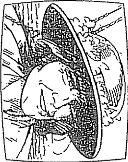
FIGURA 5-4. Un corte en concordancia. Mediante un gran cambio en el tamaño de la imagen, puede hacerse un montaje conjunto de dos planos si las imágenes concordarán.

Normalmente utilizo: un plano general, para cubrir cada una de las preguntas; un plano medio, que se utiliza cuando ya se ha iniciado la respuesta, y un plano corto, para cualquier cosa que sea especialmente reveladora o que tenga fuerza.