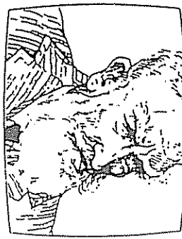
FIGURA 5-2. Si el entrevistador está a un lado de la cámara, el sujeto está hablando, evidentemente, a alguien situado fuera de imagen.

Para eliminar todo vestigio de mi contribución al proceso, me coloco en un asiento bajo, con la cabeza justamente bajo el objetivo de la cámara. Aunque el entrevistado se está dirigiendo a mí, parece que está hablando directamente con la cámara (es decir, la audiencia). Cuando se elimina mi voz al efectuar el montaje, se deja a la audiencia en relación directa con la persona que está en pantalla.