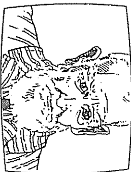
FIGURA 5-1. La colocación del entrevistador afecta la línea de visión del sujeto. Si la cabeza del entrevistador está justamente debajo del objetivo de la cámara, el sujeto habla directamente al espectador.

Estos dos sistemas tienen un efecto subconsciente en la audiencia. Personalmente prefiero eliminar totalmente al entrevistador al efectuar el montaje, para dejar a la audiencia en una relación cara-a-cara con mi entrevistado. Esto quiere decir que organizo mis planos de forma que mi sujeto esté hablando directamente a la cámara (como en la Fig. 5-1). Considero que mis entrevistas son un medio de hacer preguntas que mi audiencia desea que sean contestadas. Por consiguiente, efectivo la entrevista en representación de la audiencia, y actúo como un catalizador. Una vez que el entrevistado se pone a hablar, mi presencia como oyente es irrelevante para la audiencia e incluso supone una distracción.