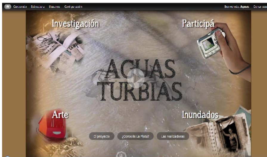
Imagen del Home

Asimismo, una vez on line los contenidos se irán actualizando, teniendo en cuenta que aún continúan abiertas las causas legales y además los testimonios seguirán revelando las distintas maneras de subsanar a través del tiempo las consecuencias tanto físicas como psicológicas de los integrantes de la comunidad.