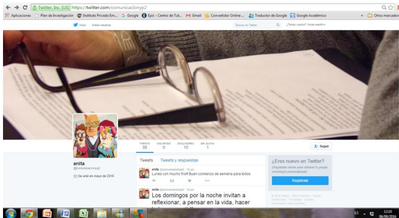
Imagen 2: Twitter de Anita López