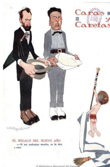
Tapa de CyC N° 902 (15-01-1916). Biblioteca Nacional de España.

El género del humorismo gráfico comporta dos fases, la denotativa y la connotativa. La primera corresponde a un primer nivel de lectura; en la segunda etapa está el mensaje político o cultural, las ideas e ideología. Esta tapa en particular hace una burla sobre los dos candidatos presidenciales. Se les muestra "pidiendo limosna", en actitud de súplica hacia los votantes, a quienes tienen que cautivar si quieren lograr el sillón de Rivadavia. La actitud de los dos personajes supone la poca posibilidad que tienen de alcanzar el triunfo. La caricatura destaca la ausencia de otros candidatos conservadores que tendrían más opciones para ganar.