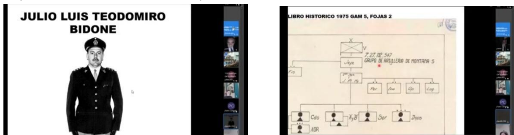
Juicio Megacausa 14, Operativo Independencia. Día 14/08/2020.

En el mismo sentido, la digitalización de documentación permitió a diferentes testigos expertos en archivos exponer sus legajos desde vía remota, haciendo posible su acceso no solo al tribunal sino también a todos los espectadores de la audiencia. Un ejemplo de ello, fue en el Juicio por la Contraofensiva el testimonio de Carlos Osorio