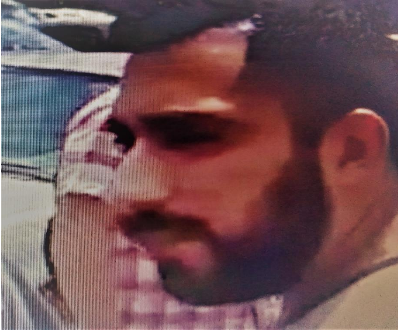
Infiltrados de la policía, en momentos de ser expulsados de una movilización.