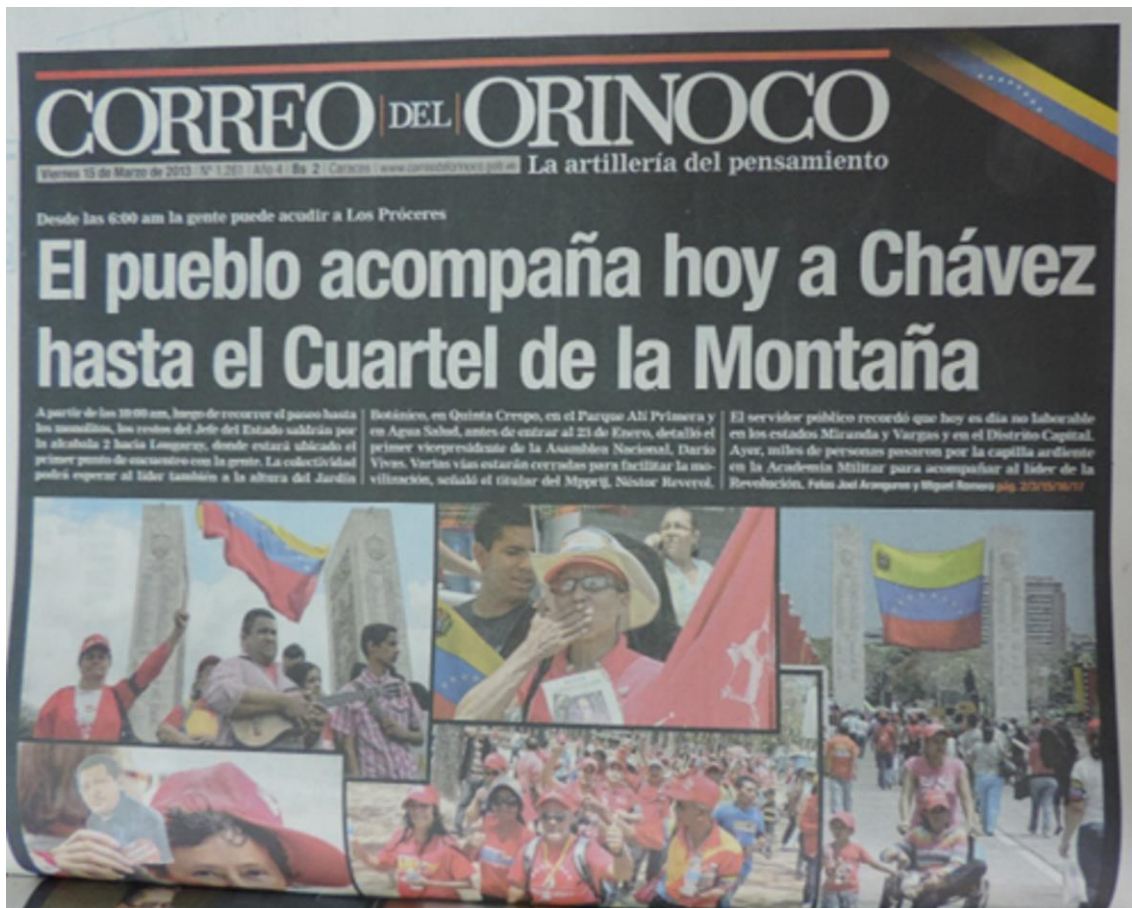
Imagen 6. Traslado del cuerpo de Chávez al Cuartel de la Montaña.

Las publicaciones del Correo del Orinoco fechadas el 16 de marzo del 2013 estuvieron enmarcadas en distintos contenidos que hacían referencia a puntos clave de difusión sobre el traslado del cuerpo del mandatario al cuartel de la montaña. Junto a esto, destaca la importancia dada a la multitud que lo despedía mientras pasaba el cortejo fúnebre, las diversas manifestaciones de dolor y amor que expresaba esa multitud. Lo representativo y simbólico que tuvo el retorno de Hugo Chávez al Museo Histórico, ahora Cuartel de la Montaña.