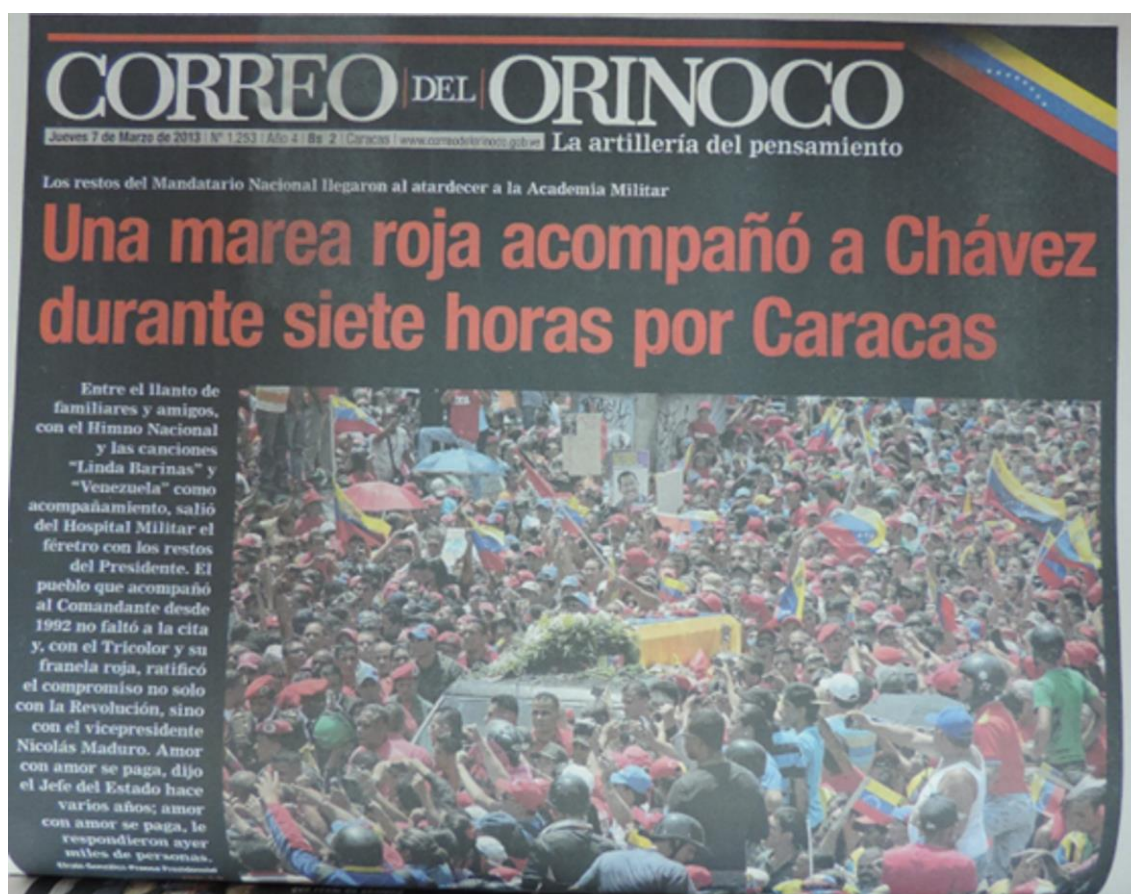
Imagen 3. Correo del Orinoco muestra la multitudinaria concentración para despedir a Chávez.

vehículos en caravana, encabezado por uno conducido por Nicolás Maduro, presidente encargado, acompañado por el presidente de Bolivia, Evo Morales.