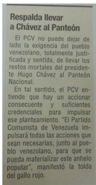
Imagen 5. Disputas sobre el sitio de entierro de Chávez en Correo del Orinoco .