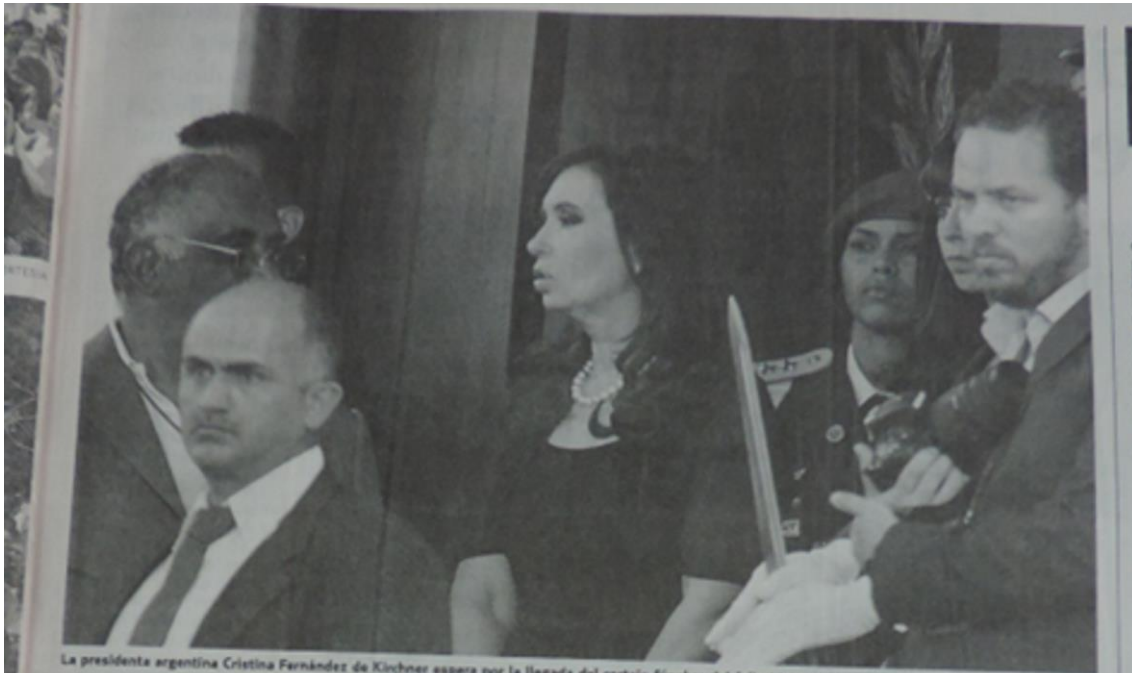
La presidenta argentina Cristina Fernández de Kirchner espera por la llegada del cortejo fúnebre del fallecido mandatario venezolano Hugo Chávez