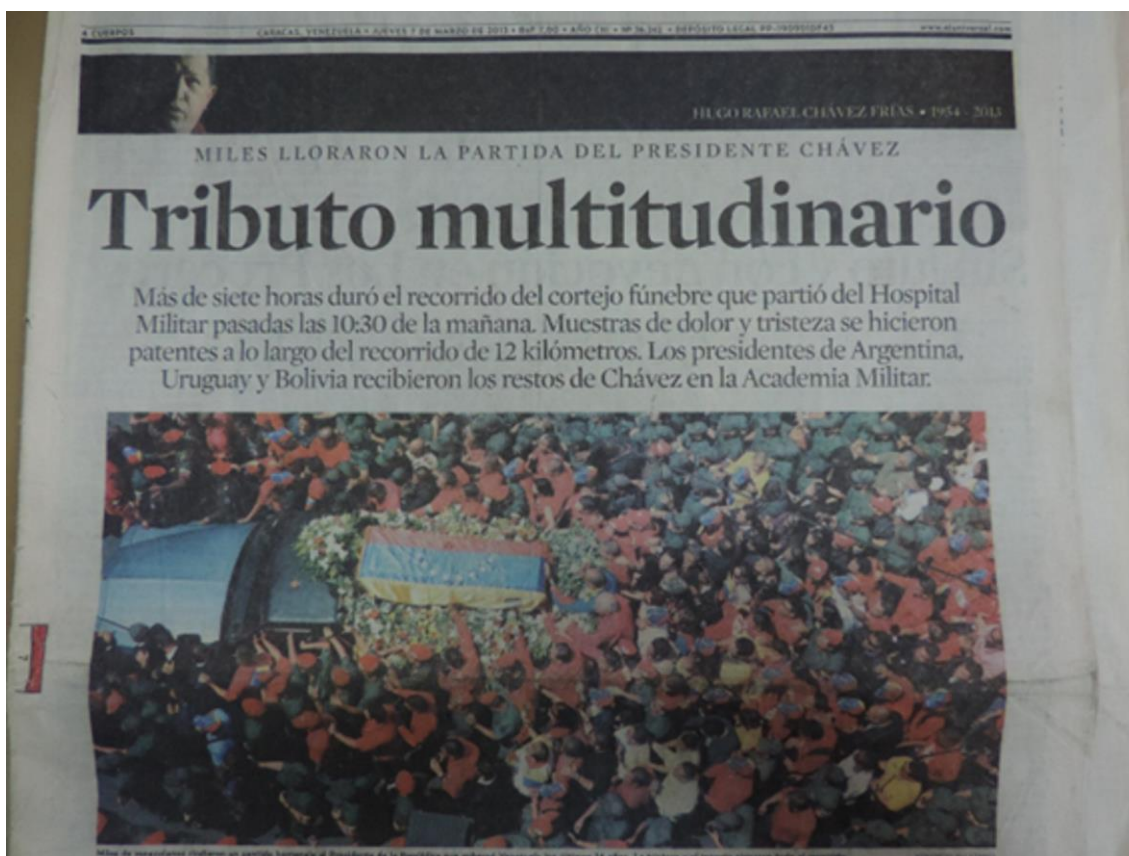
Imagen 1. Imágenes de los funerales de estado de Chávez en El Universal .

El cadáver embalsamado del presidente recorrió la ciudad capital antes del destino dispuesto para rendir los actos fúnebres, es decir, la Academia Militar, y que por 10 días pudiera ser visitado por el pueblo para ser finalmente trasladado, el 15 de marzo del 2013, al Museo Histórico Militar un sitio que constituye todo un símbolo para el proceso chavista pues fue el lugar donde se refugiaron Chávez y sus compañeros de armas cuando encabezaron el golpe de 1992. Cada sitio donde reposó el cuerpo estaba cargado de una simbología histórica acerca de los pasos que dio Chávez para llegar al poder. Su cuerpo trascendía esos hechos y mantenían vivo el recuerdo de las actuaciones que marcaron su vida. Como analiza Verdery (1999) un cadáver está hecho de sentidos, no por sí mismo, más por las relaciones culturales establecidas y por la forma con que la muerte específica de una persona es socialmente construida.