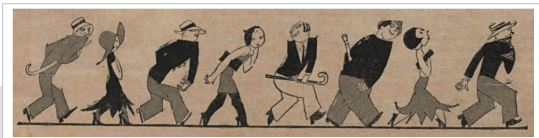
Figura 3. Os moços bonitos [Los mozos bonitos]. O Malho , 07/03/1931, p. 3.

En esta forma de hablar, los mozos bonitos no sirven para conquistar muchachas y jovencitas que saben cuidar de sí mismas.