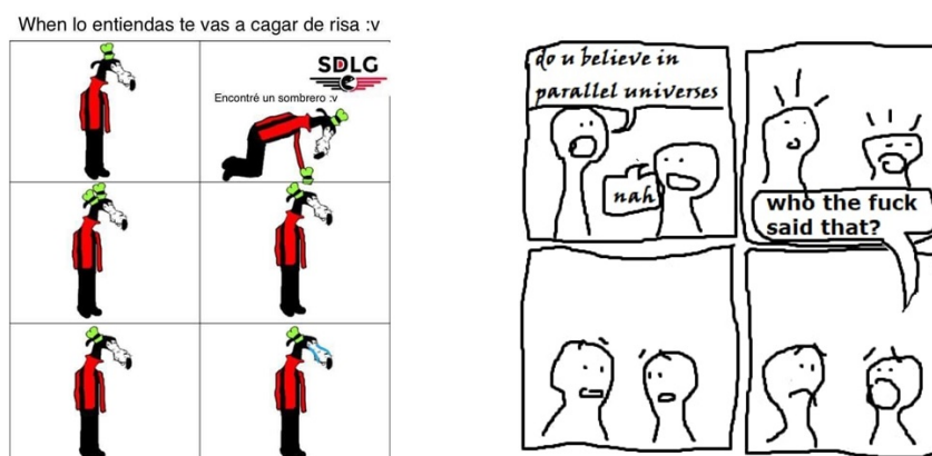
FIGURA 8 Bucles temporales en meme