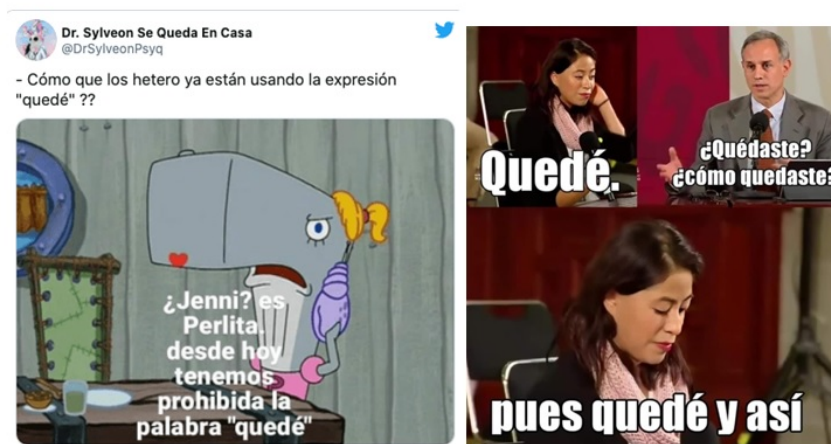
FIGURA 11 Otros ejemplos del meme “quedé”

De este modo, el sujeto LGBT+ puede eludir, mediante la utilización de un código no compartido, una discusión que entiende como improductiva y/o no deseable. Con el tiempo, este meme salió de la esfera LGBT+ y comenzó a ser usado por todo tipo de usuarios, lo que ha llevado a que el meme sea parodiado por la comunidad hetero conservadora de internet. Esta parodia implica un descrédito de sus usuarios (los progres) y, en última instancia, repercute en la utilización del meme “quedé” por parte de la comunidad LGBT+. De manera directa (mediante la ridiculización del meme y de sus usuarios) o de manera indirecta 7 (mediante su reformulación y su utilización indiscriminada) el empleo del meme por fuera de su comunidad de origen lo despoja de la cualidad retórica que le permitía romper con la situación de comunicación. Hecho que reduce, drásticamente, la longevidad del meme.