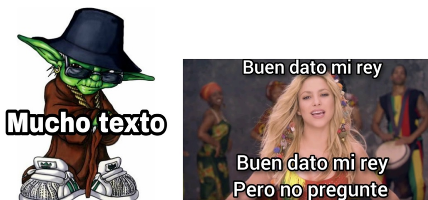
FIGURA 9 El meme “mucho texto” y “qué buen dato...”

Un ejemplo de esto son los memes de “mucho texto” que se utilizan para responder algún comentario o intervención demasiado extensa. O el “qué buen dato...”, que consiste en un audio acompañado de una imagen estática de algún grupo musical o personalidad con una voz reconocible. Lo que se busca es hacer que la frase [Figura 9] coincida con la música elegida y, al mismo tiempo, tratar de imitar lo mejor posible la voz del cantante, personalidad o grupo en cuestión. En ambos casos, los memes son utilizados para desacreditar el derecho a la palabra 6 (Charaudeau, 2005) de algún interlocutor y excluir, así, su argumento y, en última instancia, a él de la conversación.