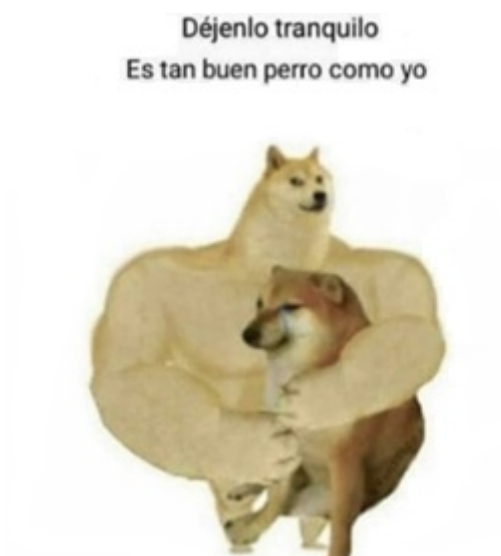
FIGURA 2 Doge abraza a Chems