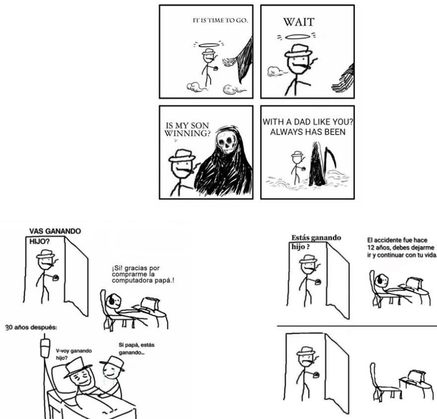
FIGURA 6 Una historia trágica de un padre y su hijo

Otras reformulaciones de este meme apelan a una crítica sobre el contenido en internet [Figura 7]. En redes suele ser común el uso del humor negro; así, en varias versiones de este meme se puede ver al hijo muerto con algún tipo de elemento (una pistola, una soga, etc.) que indica que se ha suicidado. Conscientes de este hecho, los usuarios deciden modificar este aspecto: en los ejemplos antes mencionados se ofrecen breves historias en las que los personajes disfrutaran de una tranquila vida en familia. Al mismo tiempo, estos memes refutan la brecha entre generaciones (como vimos en los memes de los perros, este tema es habitual en aquellos que realizan comparaciones): el padre se muestra interesado en los hobbies de su hijo y este último le agradece que lo entienda y no lo juzgue por sus gustos.