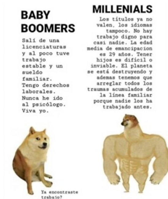
FIGURA 3 Baby Boomers vs. Millenials

En las figuras 2 y 3 se aprecia una clara modificación del meme original. En la figura 2, Doge abraza a un Chems que llora y a él se le atribuye el texto en la parte superior (por el contenido de lo dicho y por la acción de contención que realiza en el plano visual). De este modo, se percibe que ciertos sujetos, lejos de solo consumir este tipo de contenidos, realizan lecturas críticas de los mensajes y las implicaciones que en ellos aparecen; además de ser conscientes de ciertas problemáticas sociales como puede ser, en este caso, el bullying en redes.