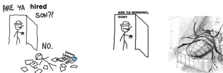
FIGURA 5 Dos ejemplos del meme “Are you wining son?”