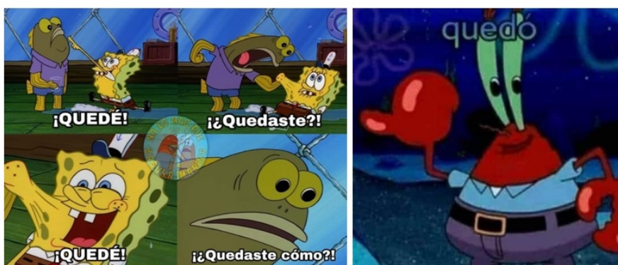
FIGURA 10 Ejemplos del meme “quedé” Fuente: Twitter

tuvo el hecho entre sus fanáticos. Luego, el meme sería utilizado por la comunidad LGBT+ como una forma de expresar su reacción ante la situación típica de tener que discutir/interactuar con personas heterosexuales. Lo interesante, aquí, es que este meme funciona como una estrategia retórica que permite romper con la situación de comunicación entablada. Al responder solo con un “quedé” [Figura 11], el otro sujeto que participa de la interacción se encuentra con los pies en el aire: no sabe de qué se está hablando, desconoce qué connotaciones puede poseer el término y tampoco puede inferir una actitud de su interlocutor (no puede saber si se trata de una agresión, un argumento, un contra argumento, etc.).