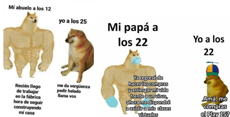
FIGURA 1 Memes del perro grande vs. perro chico

Una lectura multimodal (Kress & van Leeuwen, 2006) de este meme permite afirmar que el sentido se construye mediante un contraste entre ambos personajes. La imagen configura una semiótica del espacio visual en la que el perro de la izquierda adquiere, por su ubicación en este segmento del campo visual, el sentido de lo conocido, el pasado, lo que debe ser (Kress, Leite-García & van Leeuwen, 2001). Mientras que el perro de la derecha adquiere la significación de lo nuevo, lo problemático, lo que se cuestiona. Al mismo tiempo, el diseño de los personajes remite a representaciones sociales que indican una carga valorativa en cada uno de ellos. Mientras que Doge (el perro de la izquierda) es alto, musculoso y de pelaje rubio; Chems (el perro de la derecha) es pequeño, se encuentra sentado (en una postura de menor agencia) y tiene el pelo más oscuro. Así, se ligan ciertos sentidos comunes ligados a la estética de “lo bueno” (ser lindo, alto, fornido, etc.), por oposición a “lo malo” en cada uno de los personajes. Por último, los elementos lingüísticos (el texto) que acompañan a la imagen sirven como apoyo de lo visual; se utilizan para ubicar la comparación en diferentes situaciones de la vida diaria. En resumen, el sentido detrás del meme es que “todo tiempo pasado fue mejor”, lo que implica, a su vez, un rechazo al cambio y a las nuevas formas de lo social que se han suscitado con el paso de los años.