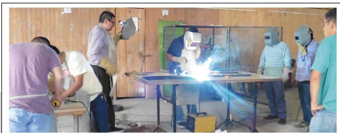
Imagen 2. Trabajadores durante la construcción del CIDAC.

Un ejemplo de esto resulta de la vinculación con el Ministerio de Trabajo y Seguridad Social, a partir de la cual se ejecutó el programa «Obra Pública Local» para la construcción del edificio del CIDAC. Mientras que desde el Ministerio se destinó financiamiento para la compra de materiales, la mano de obra para la construcción contó con la participación de doce vecinos desocupados del barrio de Barracas –perteneciente a diferentes organizaciones sociales de la zona– junto con un equipo de arquitectos [Imagen 2].