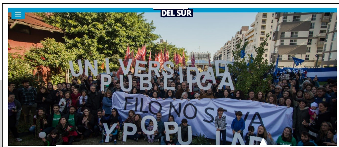
Imagen 4. Abrazo al CIDAC, en mayo de 2019, que con leyendas como «Universidad Pública y Popular» y «Filo no se va» mostraron la importancia del centro y su vinculación con el territorio.

E inmobiliaria, agregaremos nosotros. En este escenario, y con el riesgo de que el nuevo código de «espacio público» de CABA, busque desalojar al CIDAC para convertirlo en un «espacio verde», en mayo de 2019, la FFYL y diversas organizaciones sociales convocaron a un abrazo al edificio en el cual participaron diversos actores del barrio, la universidad, los sindicatos, y las organizaciones sociales y políticas, entre otros [Imagen 4].