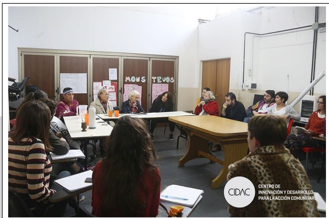
Imagen 3. Mesa redonda «Alianza con los pueblos indígenas para ejercer los derechos», realizada en el CIDAC en octubre de 2019.

La actividad tuvo lugar en la sede del centro, en el barrio de Barracas, durante la cursada del Seminario PST «Pueblos indígenas, organizaciones etnopolíticas en contextos de conflictividad». La mesa contó con invitados/as de diversos sectores y con el patrocinio de espacios científico tecnológicos –entre ellos, de la SEUBE, el Instituto de Ciencias Antropológicas de la FFYL, CLACSO, la Universidad de Lujan y la Universidad de Avellaneda– que garantizan la articulación de estos ámbitos de trabajo de extensión y de investigación. Cabe señalar que dichas actividades se financian a partir de diferentes proyectos de Universidad de Buenos Aires, Ciencia y Tecnología (UBACYT), Proyectos Universidad de Buenos Aires de Extensión (UBANEX) y Proyectos de Desarrollo Tecnológico y Social (PDTS), que tienen por objetivo la búsqueda de soluciones a problemáticas de carácter práctico, es decir, a necesidades sociales, económicas y políticas, entre otras, junto con los actores sociales.