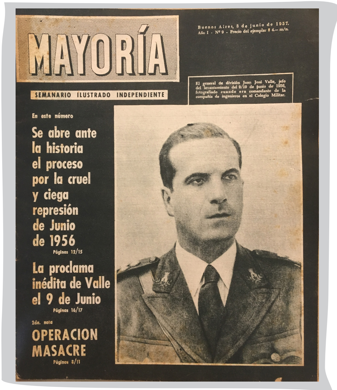
3 de junio de 1957 - Portada del número 9, edición en la que se publica la segunda entrega de la investigación «Operación MASACRE» y en la cual aparece como primicia la proclama leída al pueblo argentino, en emisiones radiales clandestinas, por los revolucionarios de junio de 1956