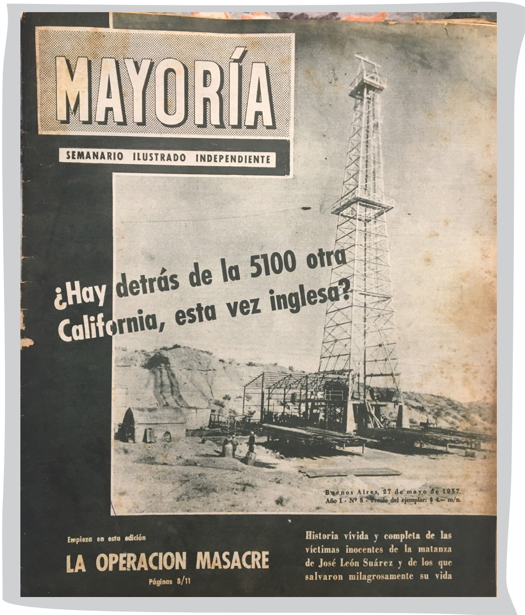
27 de mayo de 1957 - Portada del número 8, edición en la que se publica la primera entrega de «La “operación MASACRE”», la investigación periodística de Rodolfo Walsh