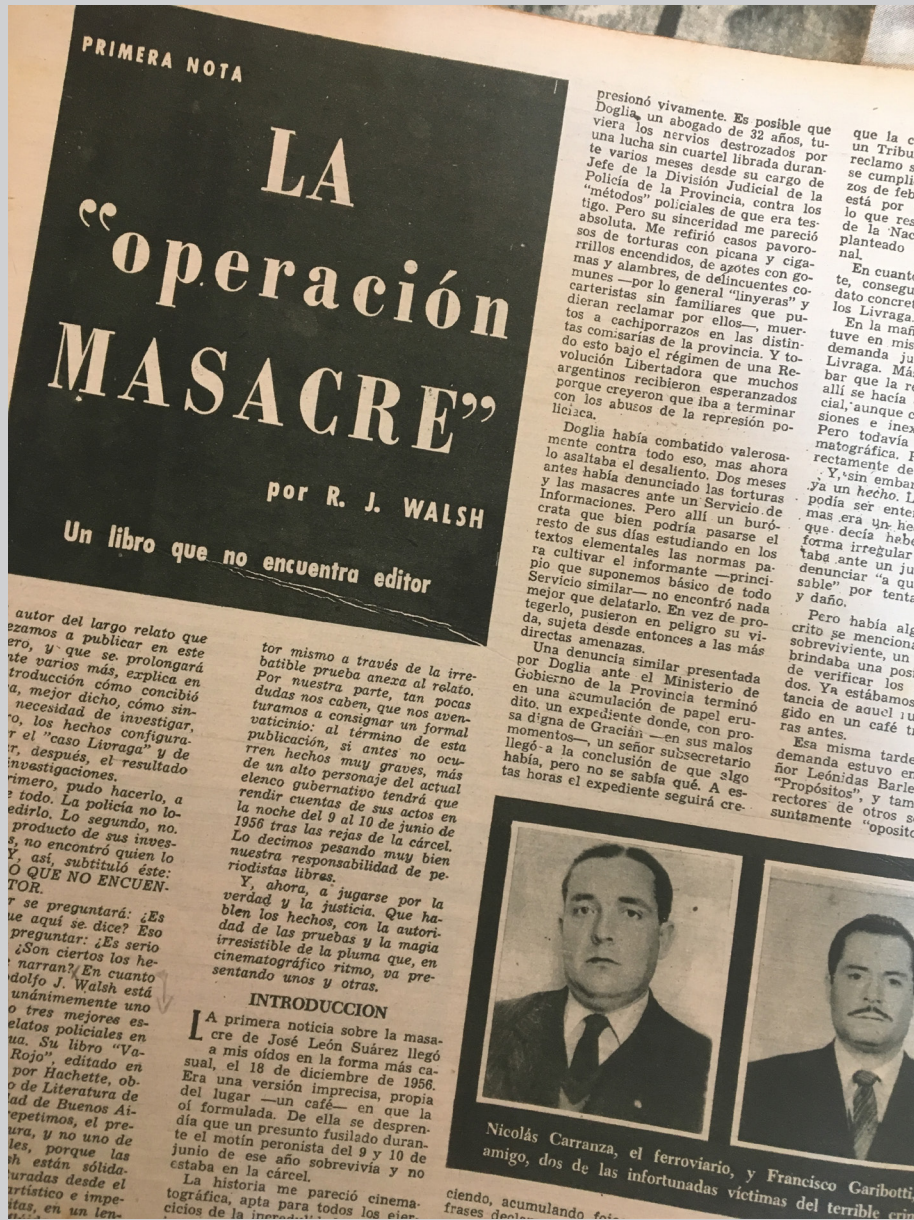
27 de mayo de 1957 - Página interior en la cual se da inicio a la serie de notas sobre «La "operación MASACRE", la indagación sobre los fusilamientos en José León Suárez, ocurridos el 9 de junio de 1956