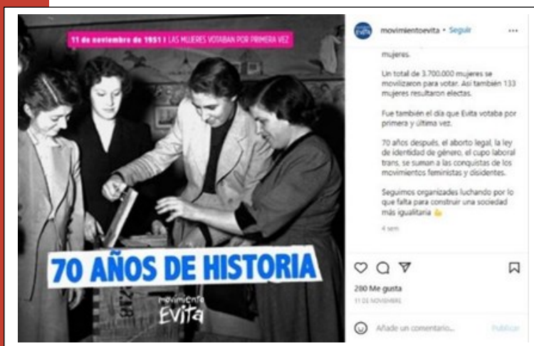
Imagen 3. Recordatorio sobre la primera votación en la Argentina donde se habilitó el sufragio femenino