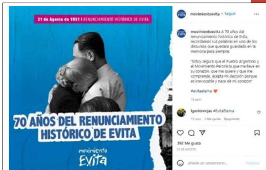
Imagen 2. Referencia al renunciamiento de Eva Perón a participar de la elección de 1951 como candidata a vicepresidenta

La imagen 1 marca la adhesión del Movimiento Evita al Frente de Todos y la valorización de un personaje cuya existencia funcionó como origen de inspiración política. Lo mismo ocurre, tal lo reflejan las siguientes imágenes, con personajes como Juan Domingo Perón y Eva Perón. En ambas, se posiciona a los líderes originarios del Justicialismo como fuente ideológica, promoviendo un anclaje de la agrupación con ese momento histórico (caracterizado por la ampliación de derechos para los trabajadores) y proponiéndose como continuidad. Lo mismo ocurre con el Papa Francisco, a quien postulan como referente moral.