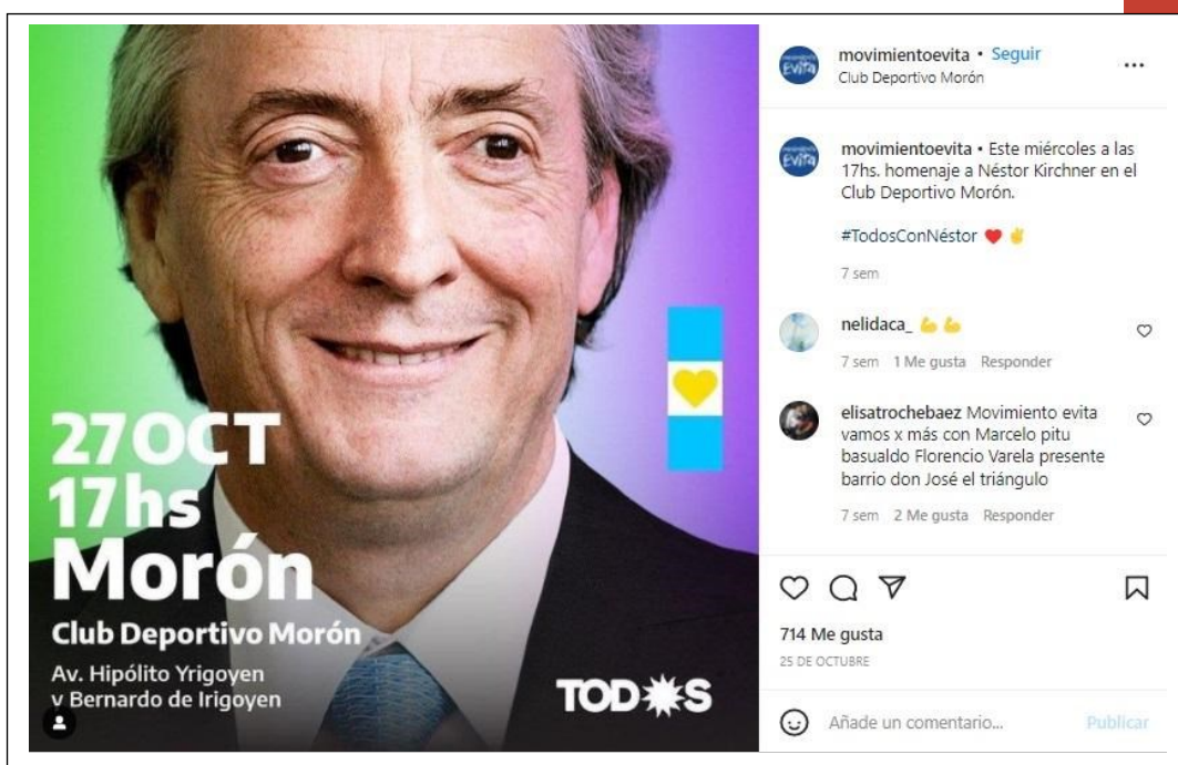
Imagen 1. Publicación del Movimiento Evita sobre el homenaje a Néstor Kirchner celebrado en 2021

En la imagen 1 se pueden ver plasmadas dos cuestiones: primero, aquella que hace a la vinculación con otras agrupaciones del frente; luego, aquella que pone a un personaje histórico como condensación de ideales políticos.