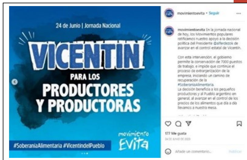
Imagen 5. Defensa del proyecto de intervención de la empresa Vicentín apelando a la soberanía alimentaria y a la extranjerización de la producción de alimentos

Los antagonismos, por lo general, no son nombrados de manera explícita a partir de la nominación de aquellos con los que se oponen, sino que tienden a tratarse de entidades –en ocasiones abstractas– definidas como quienes se oponen a sus postulados. Los siguientes ejemplos muestran el caso: