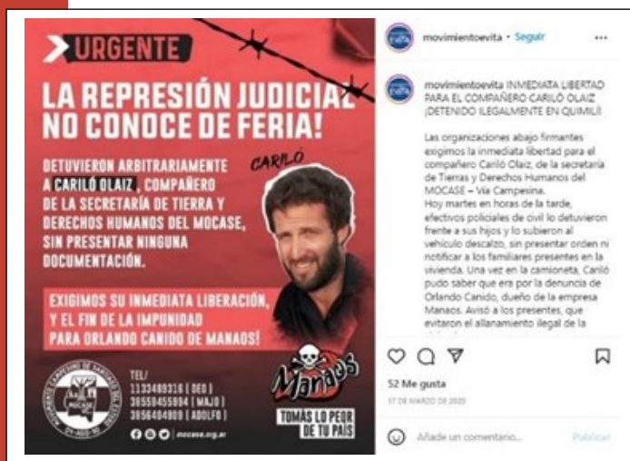
Imagen 6. Denuncia de represión haciendo referencia a injusticias que, argumentan, fueron cometidas por el Poder Judicial

En la imagen 5 se habla del inicio de «un camino de la recuperación de la soberanía alimentaria» y en la imagen 6 se denuncia complicidad de la Fiscalía