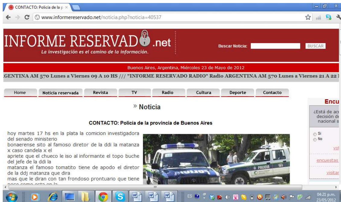
FIGURA 3: Foto de la página www.informereservado.net/noticia.php?noticia=40537 , 23/5/12, Garriga, J., Galvani, M., Melotto, M.

El sitio al que se accede tiene la particularidad de definir el perfil del "comentarista", no es común que en una publicación de interés general el espacio habilitado para comentarios se dirija a un segmento particular del público. Cuando un lector escribe su opinión en una