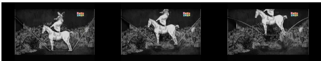
Figura 5: Montaje realizado sobre Una reina de circo , Francisco de Goya, 1823 (captura del programa Veo Veo). Aquí la equilibrista cobra movimiento y se balancea sobre la cuerda.

Para ejemplificar, en la temática “circo”, Eva y Lucio recorren distintos espectáculos circenses, a través de la obra En el circo Fernando (1879), de Pierre Auguste Renoir o Una reina de circo (1823), de Francisco de Goya, donde por el efecto del montaje, el equilibrista se mueve (Fig. 5) y Eva interactúa con las bailarinas (Fig. 6)