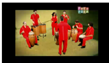
Figura 1: grupo Desconchertados dentro de la heladera. Figura 2: grupo Bomba de tiempo dentro de un cesto (captura del programa Veo Veo ).