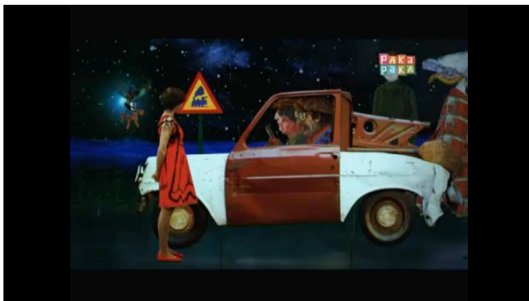
Figura 3: Eva conversa con “Juanito Laguna” en el cuadro Las vacaciones de Juanito , de Antonio Berni, 1972 (captura del programa Veó Veó ).

Otro ejemplo es la intervención que se realiza sobre el reconocido personaje “Juanito Laguna”, del pintor Antonio Berni que, sentado en una camioneta, mueve sus labios y conversa con Eva y con Lucio . Debemos aclarar que recién sobre el final de cada capítulo, durante los créditos del programa, se presentan los cuadros con su correspondiente nómina de autores.