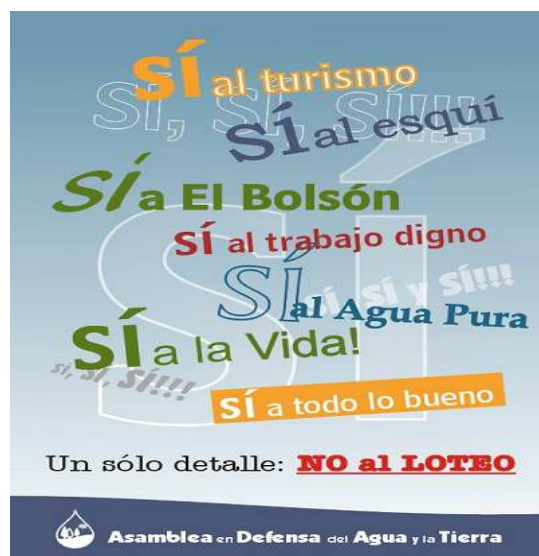
Figura N.º 3: Poster de la Asamblea en Defensa del Agua y la Tierra