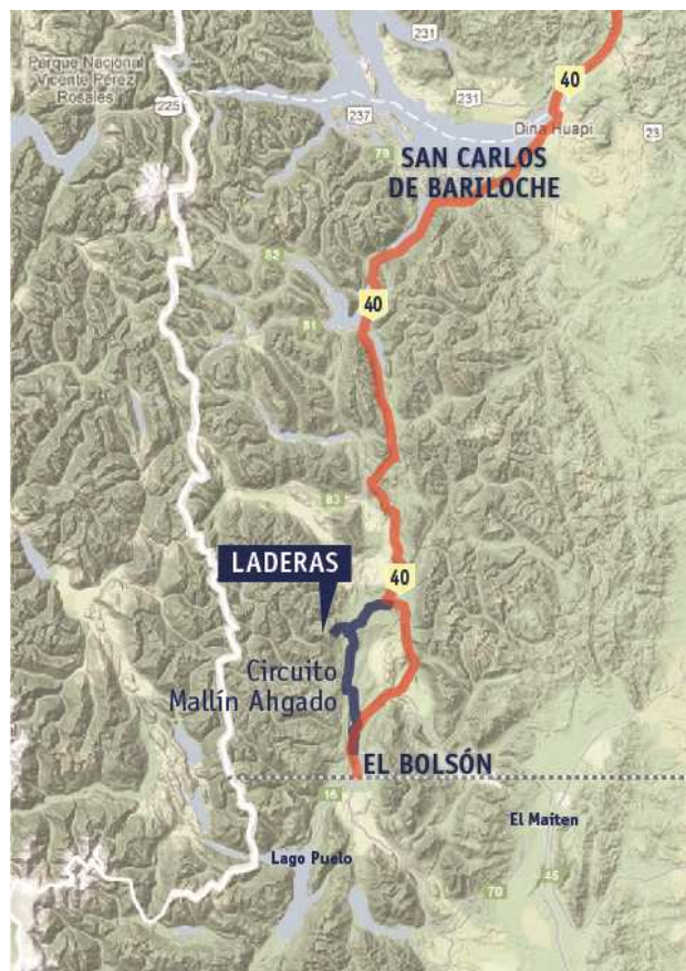
Figura N.º 1: Ubicación del Cerro Perito Moreno