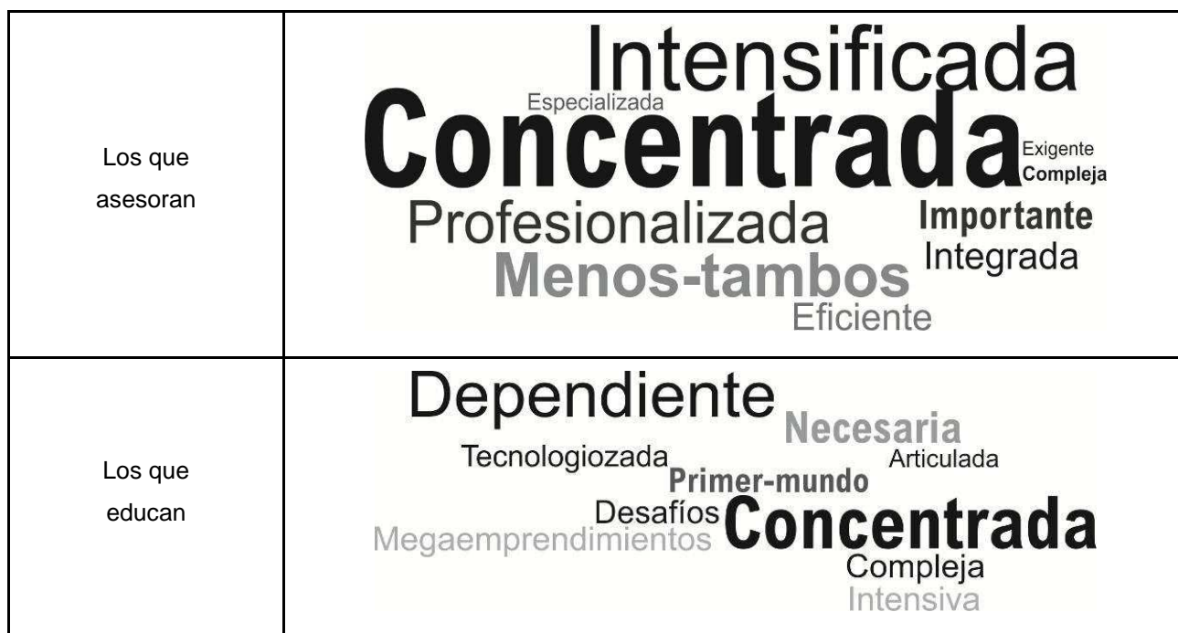
Gráfico 1. Dimensión ideológica. Informe 2, Matrices socioculturales: los que asesoran y los que educan, Proyecto Nacional Leches.