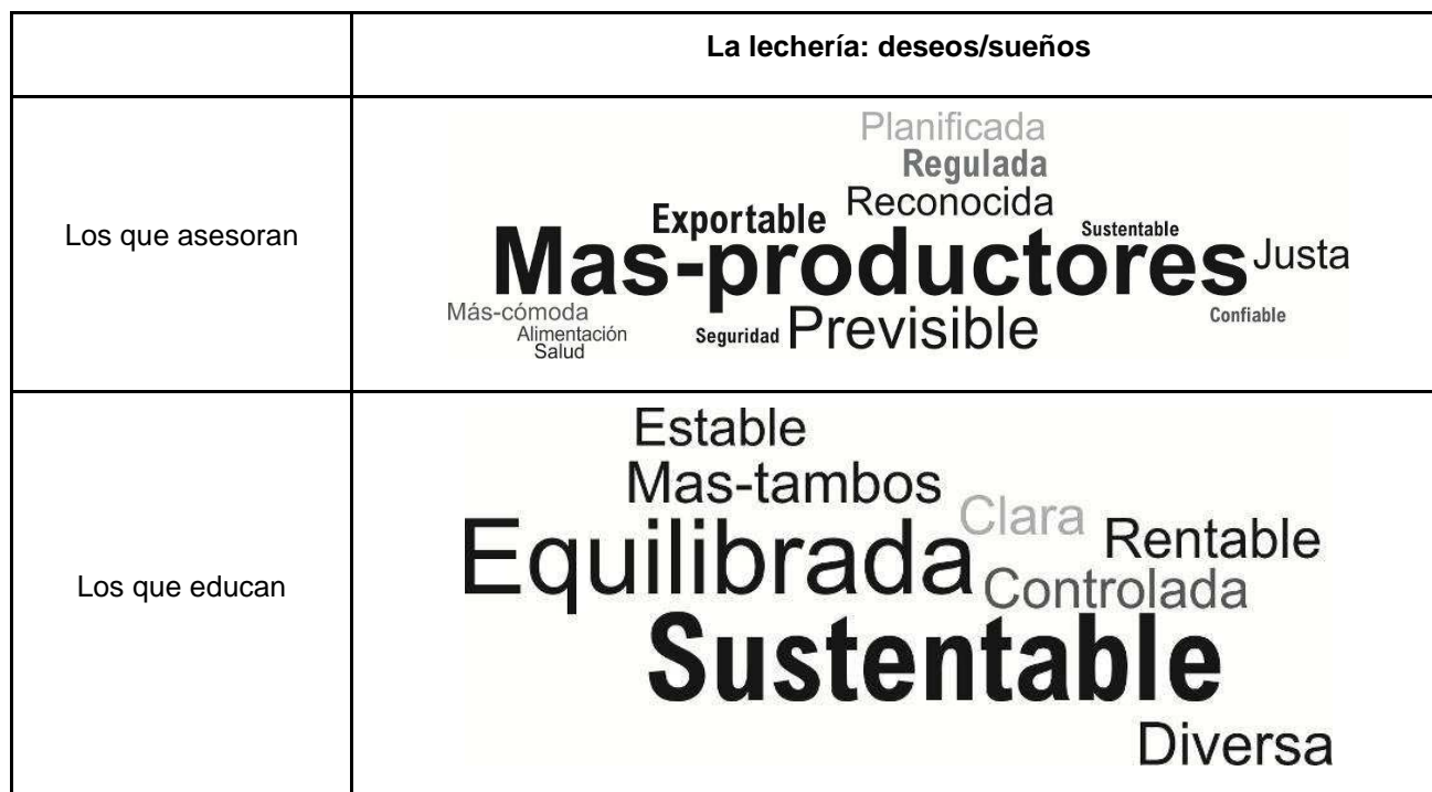
Gráfico 2. Dimensión ideológica. Informe 2, matrices socioculturales: los que asesoran y los que educan, Proyecto Nacional Leches.