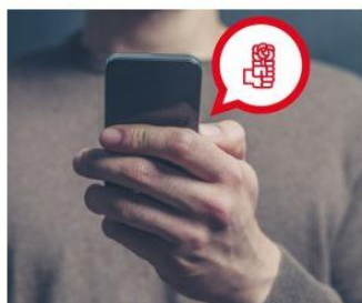
Únete al Whatsapp del PSOE