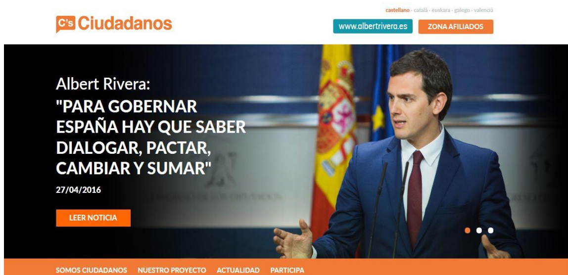
Imagen 9: Captura de la página de inicio de la web de Ciudadanos

En la cabecera, y al contrario de lo que ocurre en los otros partidos, aparece la posibilidad de cambiar el idioma de la página a catalán, euskera, gallego o valenciano. También podemos encontrar con facilidad el botón que permite afiliarse al partido.