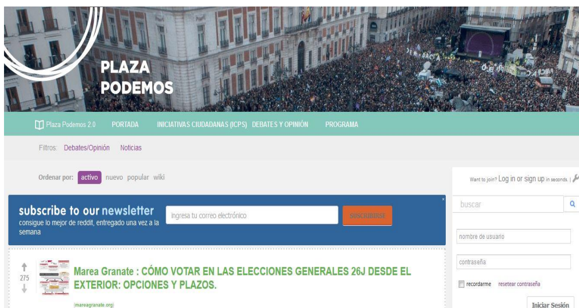
Imagen 8: Presencia de Podemos en Reddit

La presencia de Podemos en Reddit es sin duda una de las novedades más significativas en su forma de llegar al público, pues es el único partido político que hace uso de esta herramienta para conseguir cercanía con sus seguidores y simpatizantes. Reddit es un sitio web de marcadores sociales y agregador de noticias donde los propios usuarios pueden dejar enlaces a contenidos web e iniciar hilos de debate. Con esta herramienta el usuario se siente integrante de la organización política, pues la función de este medio social es estrechar el vínculo existente entre líderes y seguidores potenciando una comunicación horizontal, en contraposición a la filosofía vertical que habitualmente domina el escenario político.