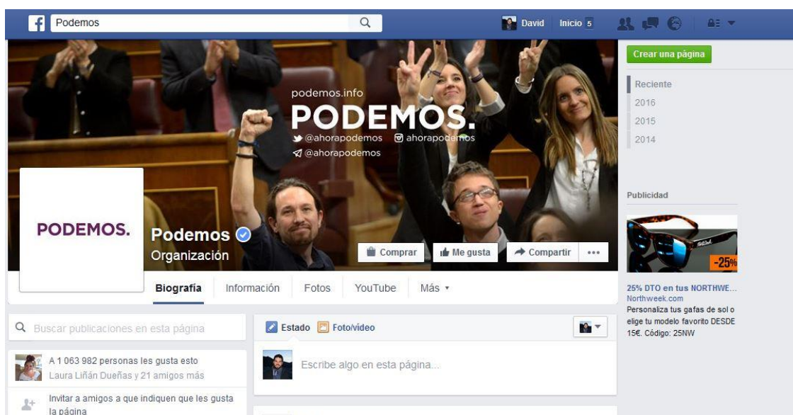
Imagen 7: Captura de la página oficial de Podemos en Facebook

Nada más entrar en la página de Facebook de Podemos comprobamos que, como ocurre en la web, en la imagen de portada apreciamos los rostros de sus principales líderes políticos, así como las diversas redes sociales en las que tienen presencia. Si nos centramos en los seguidores, la formación morada es el partido político con mayor número, pues supera el millón de personas (casi 900.000 más que PP o PSOE).