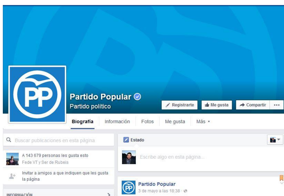
Imagen 2: Página oficial en Facebook del Partido Popular (4)

A pesar de ser el partido político más votado en las elecciones del 20 de diciembre (con más de siete millones de votos), llama la atención que los seguidores en la página oficial de Facebook apenas superan los 140.000. Este dato es significativo y nos permite interpretar que buena parte de los votantes del Partido Popular son personas mayores con escasa participación en las redes y los medios sociales.