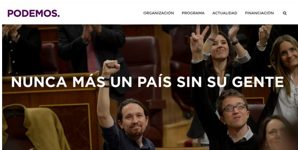
Imagen 6: Captura de la página de inicio de la web de Podemos

Podemos es un partido político personificado en Pablo Iglesias, Iñigo Errejón, Carolina Bescansa o Irene Montero, de ahí que nada más adentrarnos en su página web nos encontremos como portada una fotografía de estas personas tomada en el Congreso de los Diputados. En la formación son conscientes de la importancia de la personificación política y, por ello, se empeñan en explotar su imagen y su discurso para llegar a la mayor población posible.