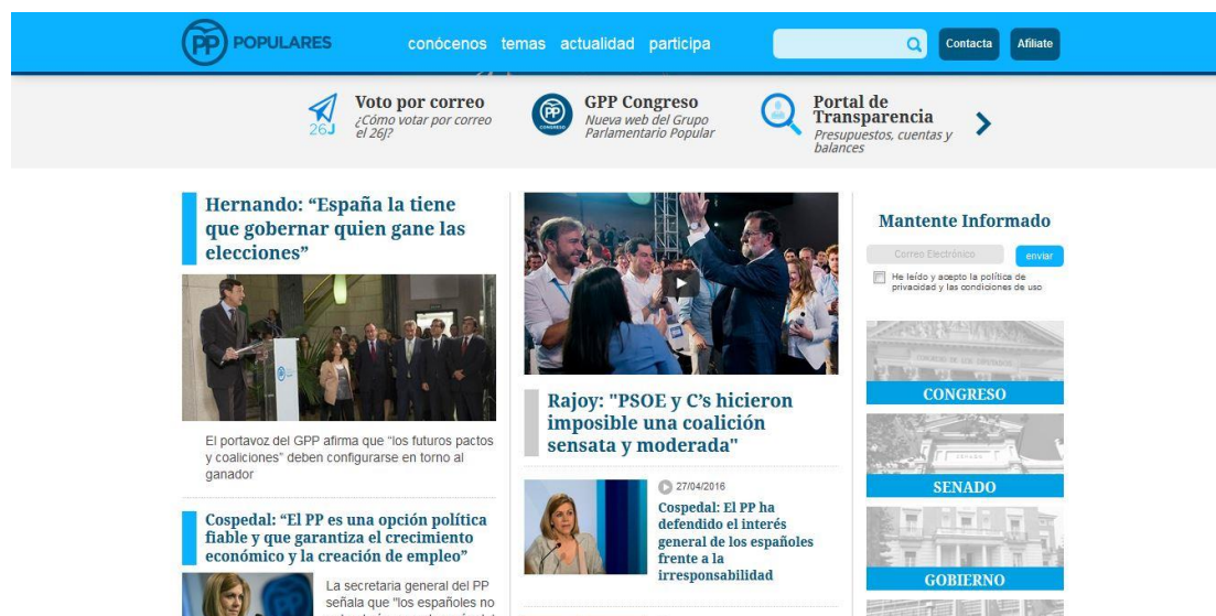
Imagen 1: Captura de la página de inicio de la web del Partido Popular

Como web de organización política su principal función es captar el voto de los ciudadanos, por lo que podríamos decir que todas las personas mayores de 18 años son sus clientes potenciales. La accesibilidad a la suscripción a la newsletter es cómoda, al igual que ocurre con la sección para afiliarse al partido. Existe un apartado donde aparece la agenda política de sus principales representantes políticos y cuyo objetivo es promocionar los actos, las visitas y las actividades relacionadas con la organización. En relación con las redes sociales también podemos encontrar en la propia web y de manera intuitiva los widgets de las redes en las que el Partido Popular está presente, facilitando de este modo el acceso directo al usuario.