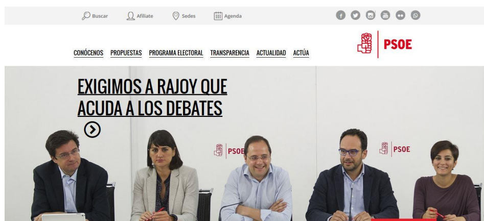
Imagen 4: Captura de la página de inicio de la web del PSOE

Si recurrimos a los datos ofrecidos por Alexa, vemos como la página web del PSOE tiene más peso y relevancia que la de su principal rival político, pues ocupa el puesto 4766 en nuestro país (España) (los populares caían hasta el 14.907), mientras que a nivel mundial ocupa la posición 163.696. Casi el 90 % de las visitas a la web socialista se realizan desde territorio español y el 57 % de las visitas lo hacen a través de los motores de búsqueda mediante las siglas del partido. Por otro lado, el tiempo medio de permanencia en la web del PSOE es de 2 minutos y 38 segundos, a la vez que son 2,30 las páginas que cada usuario visita de media en este portal.