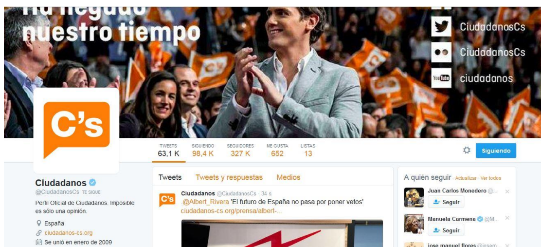
Imagen 10: Captura del perfil en Twitter de Ciudadanos

Ciudadanos usa esta cuenta para anunciar eventos y actos de su agenda, así como para retransmitir en directo intervenciones políticas y entrevistas a sus principales actores. La interacción por parte de los seguidores decae mucho con respecto a Facebook y las respuestas a comentarios de los usuarios también, puesto que aquí son casi inexistentes.