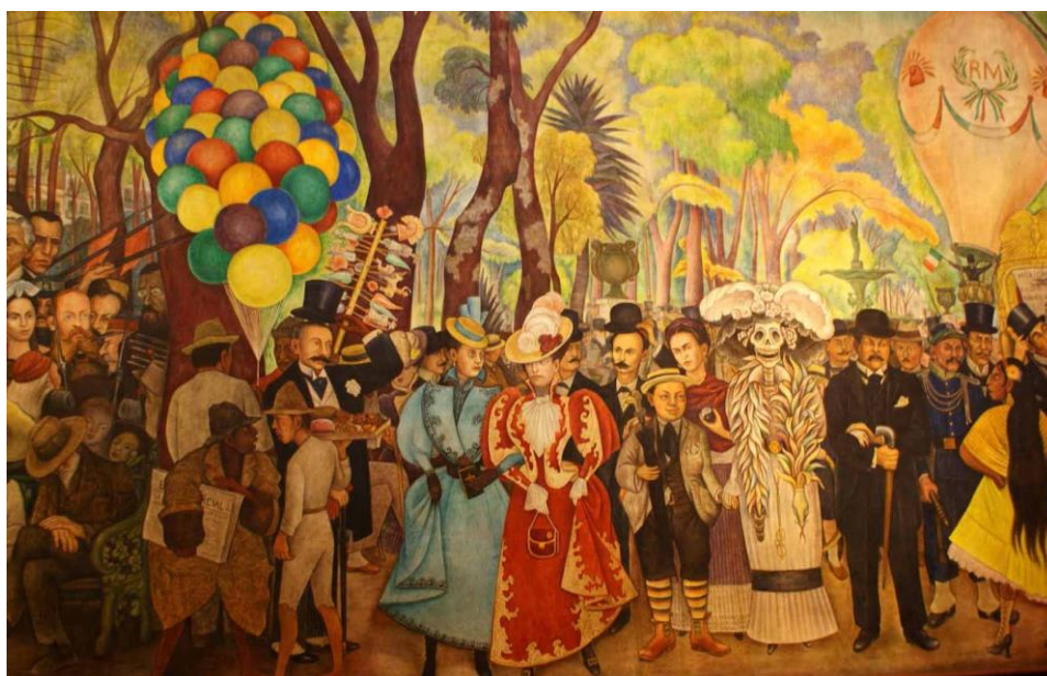
Figura 1: “Sueño de una tarde dominical en la alameda”, mural de Diego Rivera realizado en 1947.

Uno de los ejemplos más importantes en Latinoamérica, es la producción muralista que en México protagonizaron artistas como Ángel Orozco, Diego Rivera y Alfaro Siqueiros. En esos murales es posible ver representados a los grandes latifundistas miembros de la oligarquía, pequeñas comunidades campesinas, la bandera española, infraestructura francesa y las imágenes de calaveras, tradición ancestral del día de muertos. La mixtura nos impide pensar en una modernidad tardía -respecto a Europa- y homogénea, sino en procesos complejos, diferentes y, ante todo, heterogéneos. Aún hoy los procesos híbridos son las mayores riquezas, que por coerción, cohesión y consenso, construyen el palimpsesto cultural de nuestra América Latina.