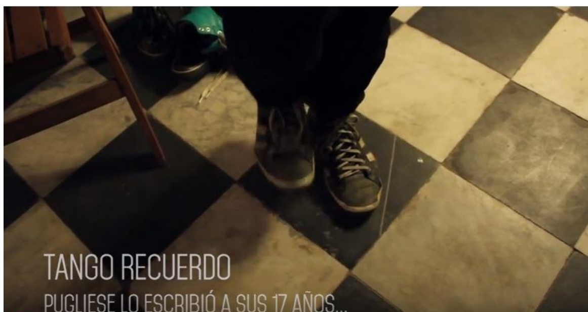
Figura 5: Imagen propia del video "#TangoNoBaja" publicado en Youtube.

En el spot #TangoNoBaja es posible analizar cómo la cuestión emocional se entrelaza con lo popular. Pero ese cruce está espectacularizado. Es contado -atención a la importancia del verbo contar- estéticamente prolijo, hay frases guionadas, planos pensados y estrategias comunicacionales, por ejemplo: se mezclan zapatos de baile de gamuza negra y roja, con zapatillas de lona que parecen ser de niños o niñas. Los personajes que se observan son jóvenes y personas adultas. Hay colibrís colgados en toda la sala y una banda tocando en vivo.