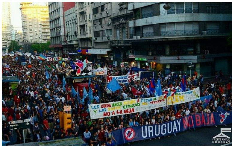
Figura 3: Marcha de cierre de la campaña “No a La Baja” llevada a cabo el 16 de octubre de 2014, a diez días del plebiscito.

debe decidir, “que tiene que pensar”, “que tiene que darle una oportunidad” a los y las jóvenes. No se crean nuevos significados sino, tal como dice Escobar, se intenta “movilizar los significados estancados y sacudir los imaginarios entumecidos” (1998: 13).