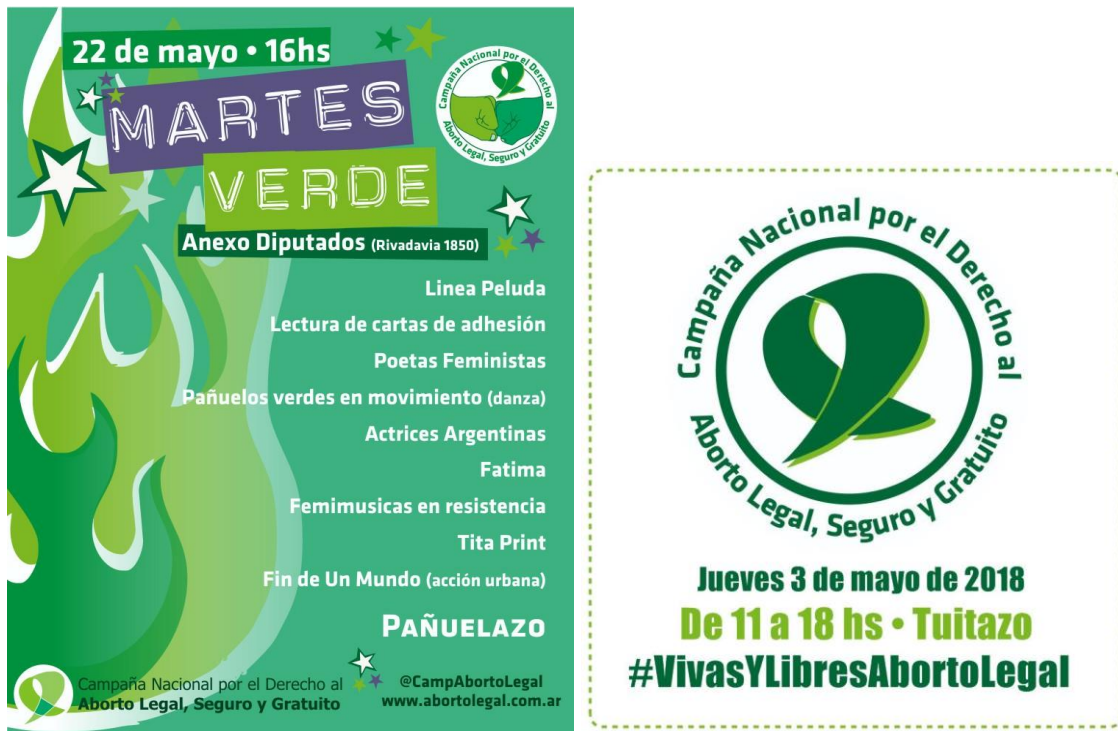
Figura 2: Flyer "Martes verde"/Figura 3: Flyer difusión "tuitazo".