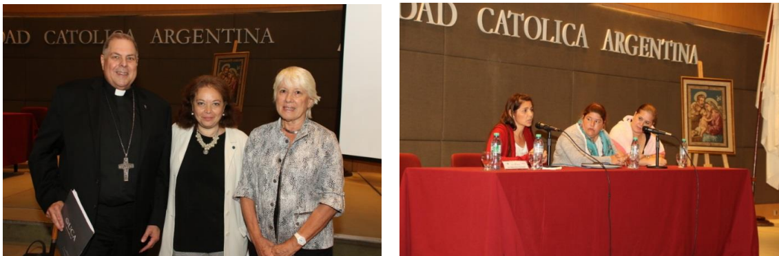
Figura 5. Jornada "Aborto: una reflexión indispensable" organizada por el Instituto para el Matrimonio y la Familia de la Universidad Católica Argentina (UCA) – Abril 2018.

Así, es destacable consignar la pertenencia a una constelación de organizaciones feministas (Mala Junta, Campaña Nacional por el Aborto Legal, Seguro y Gratuito, Católicas por el Derecho a Decidir, Red de Socorristas, Economía Feminista) y el Consejo Nacional de Investigaciones Científicas y Técnicas (CONICET) de quienes están a favor del proyecto de IVE en contraste con un conglomerado de instituciones vinculadas con la Iglesia Católica que se pronunciaron contra la propuesta (Universidad Católica Argentina, Universidad y Hospital Austral, Frente Joven, PROVIDA, etcétera; Figura 5).