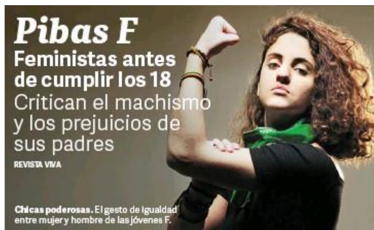
Figura 1: Fragmento de tapa del diario Clarín .

Es por esto que, en el marco de la disputa por el sentido, y alrededor del debate en Diputados, se construyó una red argumentativa/cultural para solidificar las posiciones, amplificar la demanda y dar continuidad a la llamada "revolución de las hijas" (10), las "anti princesas" (11) que tomaron el espacio público. El clima de época es tal que el 22 de julio de 2018, el periódico Clarín destinó parte de su portada y la tapa de su revista dominical ("Viva") a las "Pibas F: feministas antes de cumplir 18" (Figura 1).