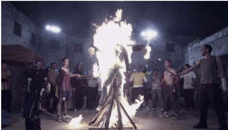
Figura 1: sub-21 y Pastor prendiendo fuego a muñeco, escena 102.

Al ver por primera vez como espectadores/asesta escena (Figura 1) se nos presenta la imagen estereotipada de sociedades primitivas alrededor del fuego y con la concepción -evolucionista (Boivin, et al. 2004)- de estas como “salvajes” en tanto cercanas a la naturaleza y/o lo animal. Esta técnica retórica utilizada en esta escena supone una inducción lógica que no es científica, sino “pública” (Barthes, 1970) en la cual se van encadenando ideas, palabras o hechos, de manera implícita con el fin de transmitir un contenido determinado.