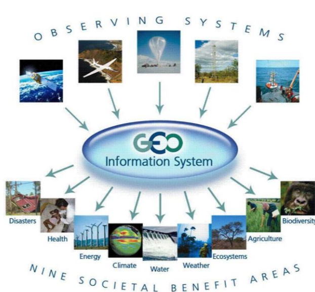
Figura 1. Áreas de Interés de IEEE.

Earthzine clasifica su contenido de la siguiente manera: