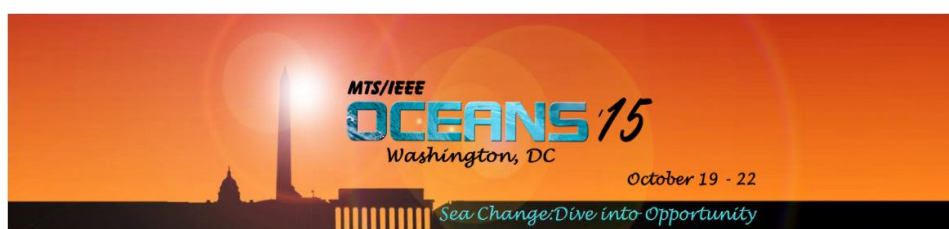
Figura 6. Banner del evento. (Fuente: gentileza Gerardo Acosta).

- Sudamérica en el 15 Congreso de los Océanos. Los artículos de Sudamérica presentados en el congreso OCEANS '15 reflejan de manera especial cómo la productividad actual en la región está cambiando los intereses de la ciencia y tecnología (Figura 6).