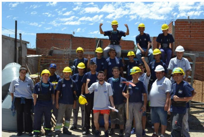
Figura 1. Trabajadores de la cooperativa Los Topos. Barrio Derqui, Caseros. Fotografía: Malena García

La cooperativa Los Topos se formó a partir de un grupo de jóvenes con antecedentes penales que comenzó a hacer trabajos de albañilería en el barrio Derqui de Caseros. La formalización de este trabajo en el marco cooperativo les permitió ampliar los trabajos de obra pública a canchas de fútbol, plazas, instalación de cloacas y conexión de agua potable; lo que les permitió aumentar la cantidad de puestos de trabajo. Los testimonios de Araña y Hueso, que citamos a continuación, remarcan que la cooperativa no surgió como una elección entre distintos tipos de asociaciones productivas, sino a partir de una necesidad concreta, encausando una organización de liberados que ya existía previamente. Además, se representa como una decisión entre alternativas acotadas: