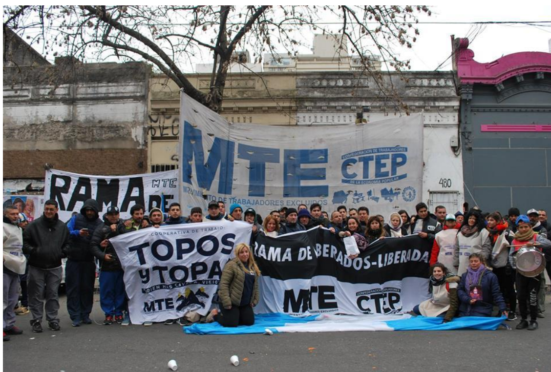
Figura 4. Rama de liberados y liberadas de la CTEP en una movilización a la Secretaría de Derechos Humanos de la provincia de Buenos Aires, exigiendo la implementación de políticas de reinserción laboral para los y las ex detenidas. 17 de julio de 2018.