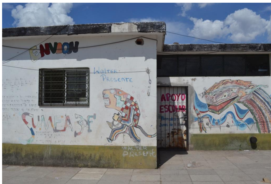
Figura 4. Comedor en el barrio Derqui, Caseros.

de las cooperativas Los Topos, Las Topas y Las Termitas a la Confederación de Trabajadores de la Economía Popular (CTEP).