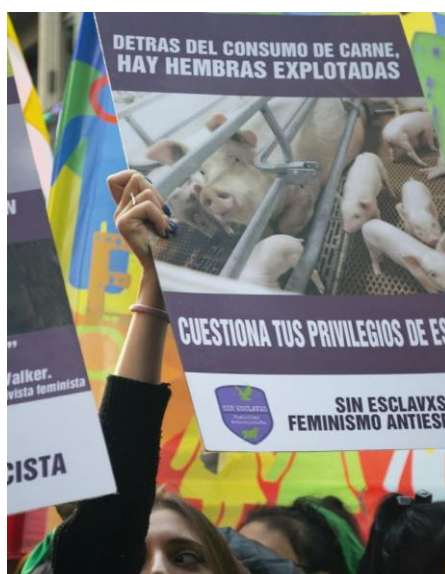
Figura 8. Transfeminismo Antiespecista

En este caso persiste parte del especismo discursivo, a través del término hembras , utilizado comúnmente para referirse a animales no humanos, pero aquí está asociado a otro término que se refiere, por lo general a individuos con el rasgo [+humano]: explotación.