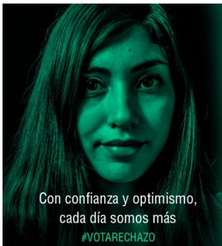
Imagen N° 4: mujer joven

El borde de la imagen, carente de un marco genera un efecto de olvido del carácter representacional de la imagen «se la presenta ya no como un enunciado visual, una interpretación, sino una vez mas como el mundo mismo» (Joly, 2009, p.129), así, el marco difuminado se olvida y confunde con los límites de la imagen central (el rostro), delimitando el campo visual, generando una tensión; por un lado la impresión de que al ampliar el marco de la imagen, sería posible observar que hay mas allá del rostro, esto es un límite que actúa como una ventana sobre la cual podríamos introducir la mirada, así, de forma imaginaria completamos el campo representado, sin embargo por otro lado, eso potencialmente observable se mantiene en las oscuridad, hay algo mas allá pero está oculto en las sombras.