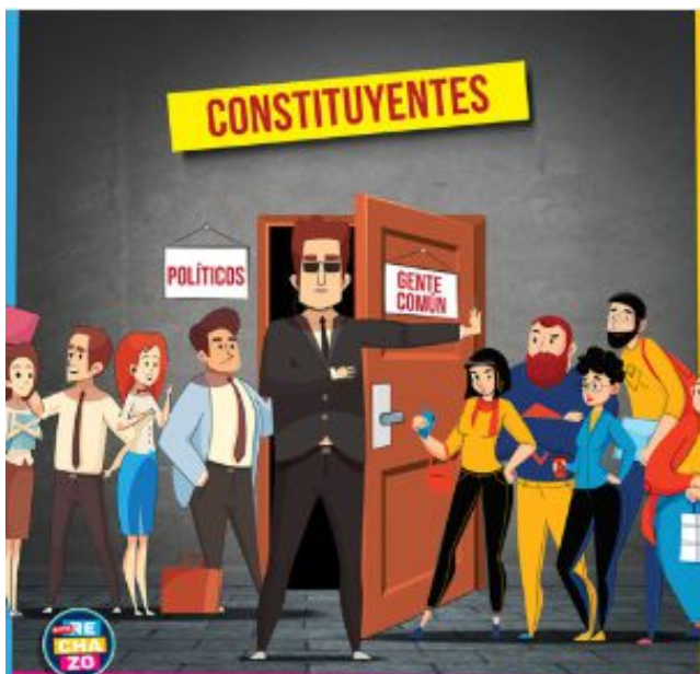
Imagen N° 7 Hombre de negro

En la imagen N° 7, la propaganda (caricatura) muestra a un personaje central, que posee el control de entrada a una sala, cuya puerta de acceso entre abierto posee la etiqueta Constituyentes . El dominio fuente evoca la figura de un Hombre de negro esto es un agente secreto, típico de series o comic norteamericanos (Comic The men in black del año 1990; Película Hombres de negro del año 1997, también personajes similares en Dark City , The Matrix , The X-files , entre otras), de carácter hosco y malhumorado, perteneciente a alguna agencia de gobierno, que junto con proteger a la humanidad, le oculta al mundo los orígenes de posibles amenazas alienígenas o de otra especie. La figura muestra a este hombre de negro impidiendo con su mano el avance de un grupo de personas etiquetadas con la expresión Gente común , el cual es un cartel que está sobre la puerta cuya abertura, junto con la mano del Hombre de