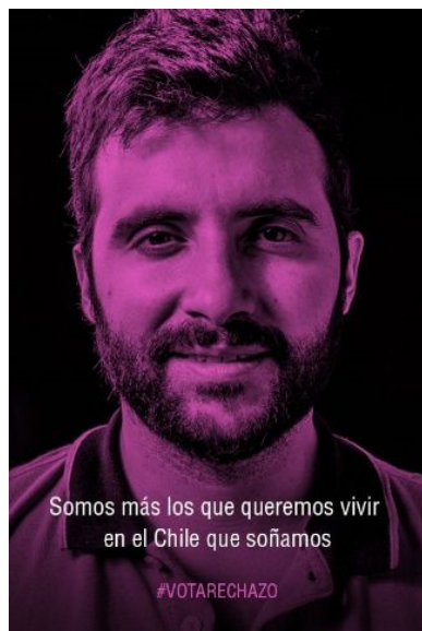
Imagen N° 2: hombre adulto