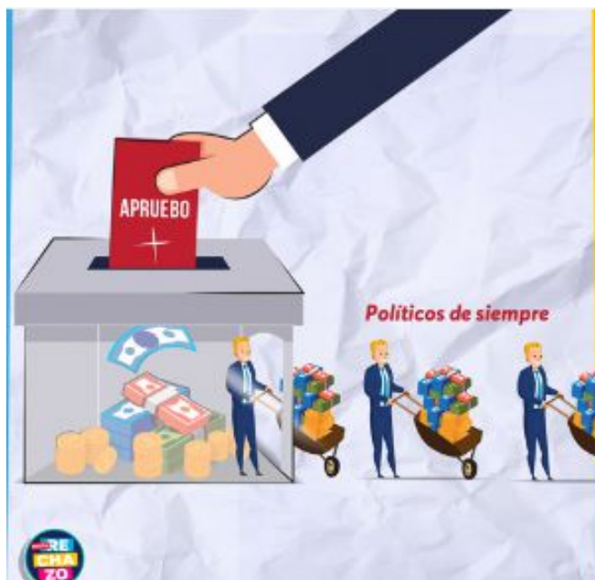
Imagen N° 8 Carretilla con dinero

democrática, en este sentido el texto Políticos de siempre como anclaje de la metáfora de llevarse el dinero en una carretilla llena, aprovechándose de la democracia, muestra a estos políticos de siempre con el sólo esfuerzo de trasladar la carretilla, ese es su trabajo. Entonces la opción del rechazo, por antonomasia refuerza la idea de una sociedad donde el dinero y los privilegios asociados es fruto del trabajo (y no necesariamente de la estructura de oportunidades que la misma sociedad establece). Cabe destacar que quien deposita el dinero es un personaje del cual sólo vemos su mano y brazo, y se distingue en él que viste de traje, en esta ocasión el estereotipo del político formal, que si bien representa al pueblo, vota apruebo para seguir reproduciendo esta lógica de aprovechamiento económico de la democracia.