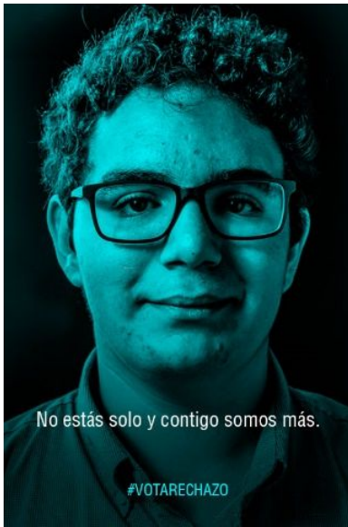
Imagen N° 1: hombre joven