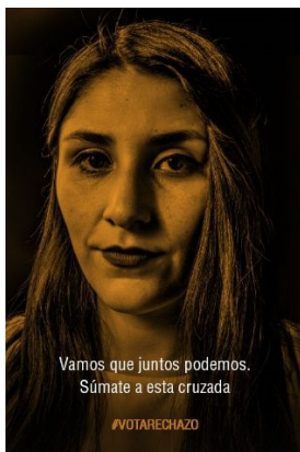
Imagen N° 3: mujer adulta

Las imágenes muestran una iluminación artificial, lo que permite acentuar el sentido de una realidad alternativa o posible, relacionada con una atemporalidad más propicia a la duda o a un sueño (en oposición al realismo que supone una iluminación natural), este rasgo es complementado en textos que proponen la posibilidad de una realidad que no es, Vamos que juntos podemos. Súmate a esta cruzada (Imagen N° 3), la implicatura es que solos, como la imagen representada, no se puede lograr en forma exitosa el triunfo de la opción Rechazo el cambio de constitución. Por tanto, en la situación real, están solos, si te sumas a la cruzada es posible una realidad distinta (ganar el plebiscito). No estás solo y contigo somos más (Imagen N° 1), la implicatura, tú crees que estás sólo o te han hecho creer que estas solo, por tanto, además de asumir la situación de engaño, si te sumas y acompañas la opción del rechazo, serán más (realidad posible). Ahora, la apelación a una realidad posible no sólo se refiere al escenario de ser mayoría sino a una mayoría con expectativas particulares Somos más los que queremos vivir en el Chile que soñamos