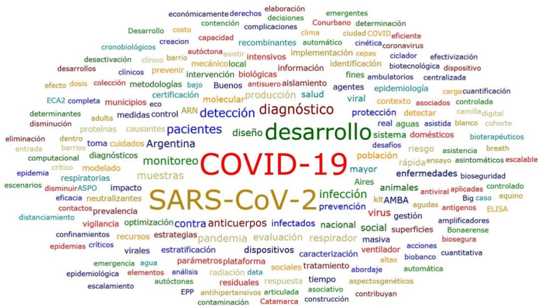
Figura 2. Nube de palabras de títulos de proyectos seleccionados. El tamaño de las palabras resulta de la cantidad de repeticiones en los títulos. La figura presenta aquellas que aparecen al menos dos veces.

La siguiente nube de palabras (Figura 2) se trabajó con los títulos de los 64 proyectos seleccionados y se presentan aquellas palabras con más de dos repeticiones. Se destacan 30 apariciones del concepto COVID-19; 27 veces SARS-CoV2; 20 desarrollo; 9 diagnóstico; 7 detección y pacientes; 6 infección y monitoreo; 5 anticuerpos, Argentina, muestras y pandemia; 4 diseño, evaluación, producción, respirador, social y virus.