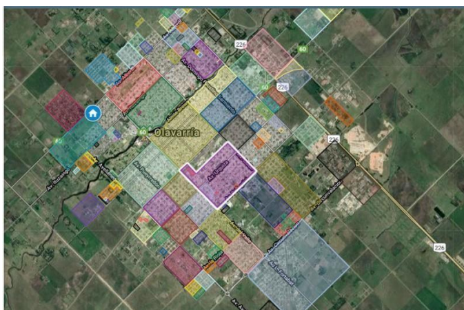
Figura 3. Plano de los barrios de la ciudad de Olavarría.

El escenario empírico de esta investigación es una escuela estatal, ubicada en un barrio al nor-oeste de la ciudad de Olavarría, caracterizada como urbana, por el sistema educativo argentino (cita) , cuyo origen se remonta a principios de la década del 1960. Se encuentra dentro un barrio (figura 3) que cuenta con la totalidad de los servicios públicos y a la misma concurren niños y niñas que viven en otros barrios que se encuentran en un radio de más de 15 y 20 cuadras de la zona céntrica de la ciudad.