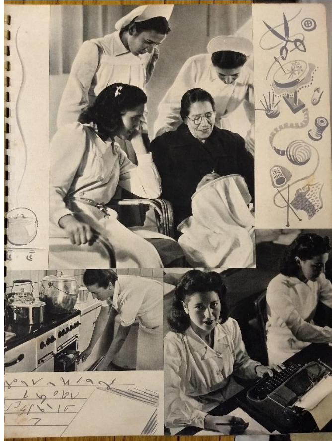
Figura 2: en el área de Acción Social Femenino se enseñaban diferentes oficios: dactilografía, tejido, costura, cocina, etcétera. Interior de la Revista de Acción Social del Frigorífico Gualeguaychú, editado por Publicaciones Pessano, Buenos Aires, octubre de 1947.