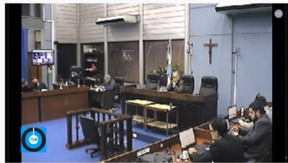
Juicio Por Lesa Humanidad "Megacausa 14" en TOCF Tucuman Junio 2020

Tribunal de Tucumán. Causa Operativo Independencia. 25 de junio de 2020.