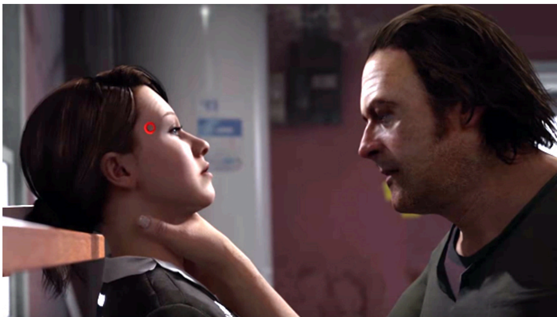
Figura 2: escena de violencia por parte del dueño hacia Kara (Fuente: Detroit: Become Human, 2018).

Un elemento que resulta relevante destacar en dichos capítulos es el referido al miedo. En su trabajo sobre la política cultural de las emociones, Sara Amhed (2015) considera que el miedo funciona para restringir la movilidad de ciertos cuerpos a través del movimiento o expansión de otros. La autora afirma que el miedo al mundo como un escenario de posibles daños o amenazas de violencia impacta sobre los cuerpos colocándolos en un estado de temerosidad. Este encogimiento puede expresarse en la negativa de salir del espacio privado (el hogar) o a negarse a habitar lo público (lo que está afuera) para evitar posibles daños. Los sentimientos de vulnerabilidad y miedo moldean los cuerpos feminizados, a la vez que determina la manera que estos ocupan el espacio. En consecuencia, el miedo asegura una feminidad limitada en el espacio público y con mayor presencia en el espacio privado. Lo que permite que los espacios se transformen en territorios, reivindicados como privilegios para algunos, es la regulación de los cuerpos en el espacio mediante la distribución desigual del miedo (Ahmed, 2015).