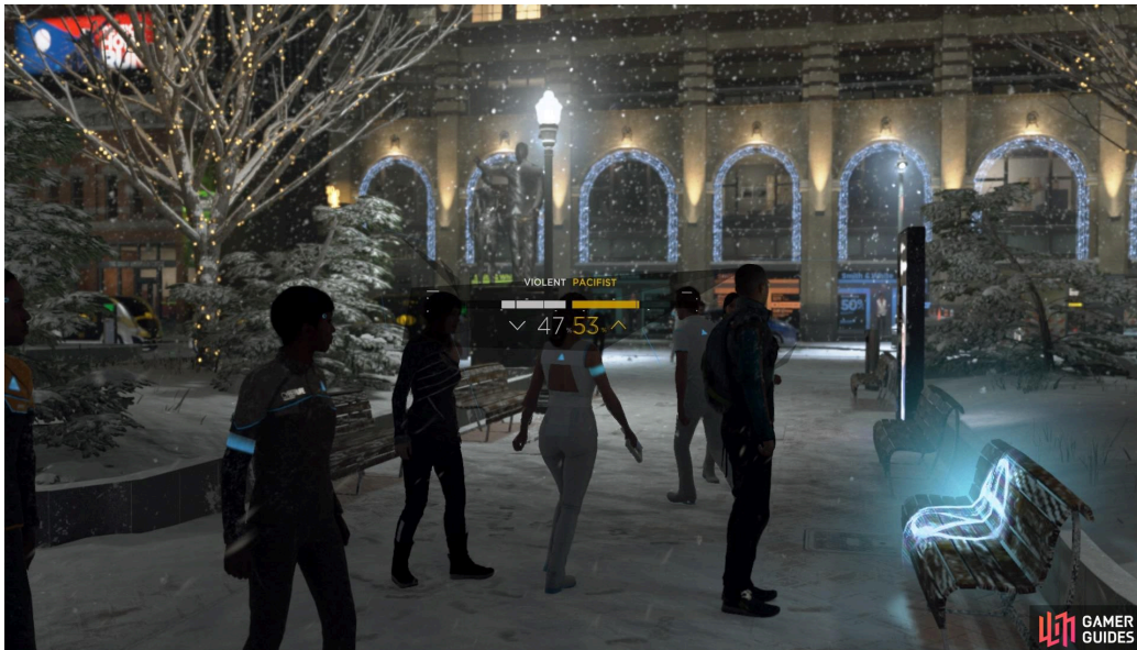
Figura 1: capítulo “Capitol Park” en el que se ofrecen distintas modalidades de intervención del espacio público en DBH

Luego tendremos misiones en las cuales nos relacionamos directamente con la ciudad. Una de ellas nos permite optar entre destruir el espacio público o intervenirlo. El desarrollo de la historia dependerá de cuál estrategia elijamos para direccionar el movimiento de Jericho. Se nos presenta un dilema en el que debemos decidir si optamos por acciones pacíficas o un enfrentamiento abierto y revolucionario.