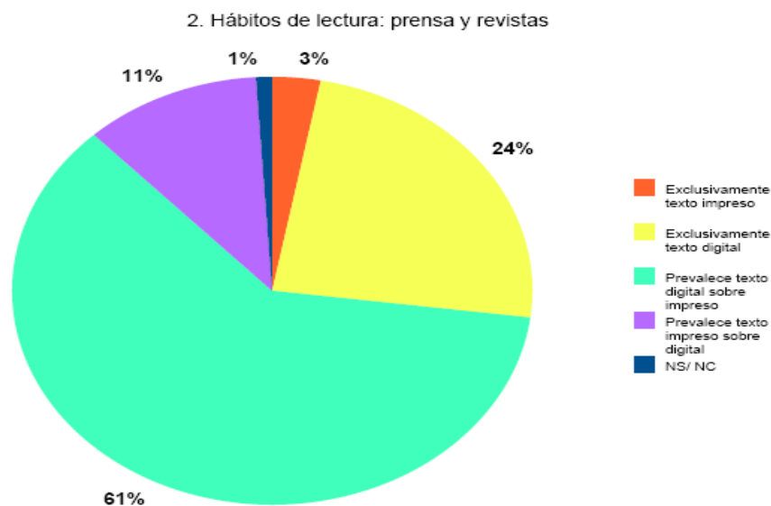
Gráfico 2. Hábitos lectura prensa y revistas. Investigación libro/ e-book. David Caldevilla Domínguez

El 61% de los encuestados combina lo impreso y lo digital pero con preponderancia de la última modalidad de lectura. Sorprende el dato que sostiene que un 21% de los individuos estudiados sólo emplea el texto electrónico para su lectura en este contexto de prensa, revistas y derivados. Si asociamos a los que utilizan únicamente el formato impreso, los que en sus hábitos prevalece este con respecto al digital, sólo suman un 14% del total de la muestra analizada, lo que constituye un dato para tener en cuenta.