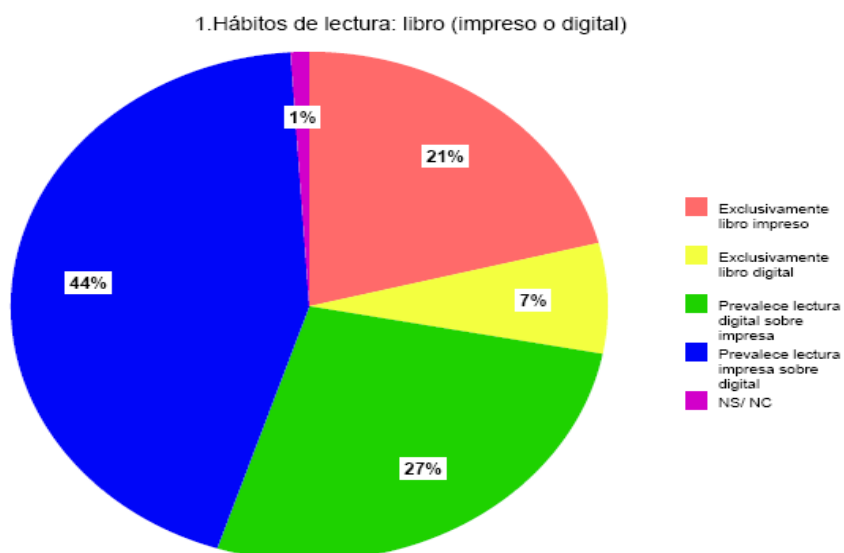
Gráfico 1. Hábitos lectura libros. Investigación libro/ e-book. David Caldevilla Domínguez

En cuanto a los hábitos de lectura de libros (tanto impresos como digitales) cabría destacar al libro impreso como el favorito del actual lector en líneas generales (Gráfico 1).