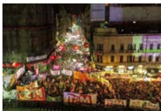
Fotogalería de clarín.com

Lo que vamos a ver acá, es que a lo largo de estas coberturas fotográficas hay como diversas políticas del encuadre, por parte del fotoperiodismo canónico. En el caso del alejamiento, hay un lugar de enunciación. ¿Por qué? Porque el medio aquí lo que hace jugar es la imposible objetividad porque es el equivalente del dato duro; la multitud puede "contarse" por cuadras, entonces crea el efecto de neutralidad que, sobre todo, es muy fuerte cuando empiezan estas marchas.