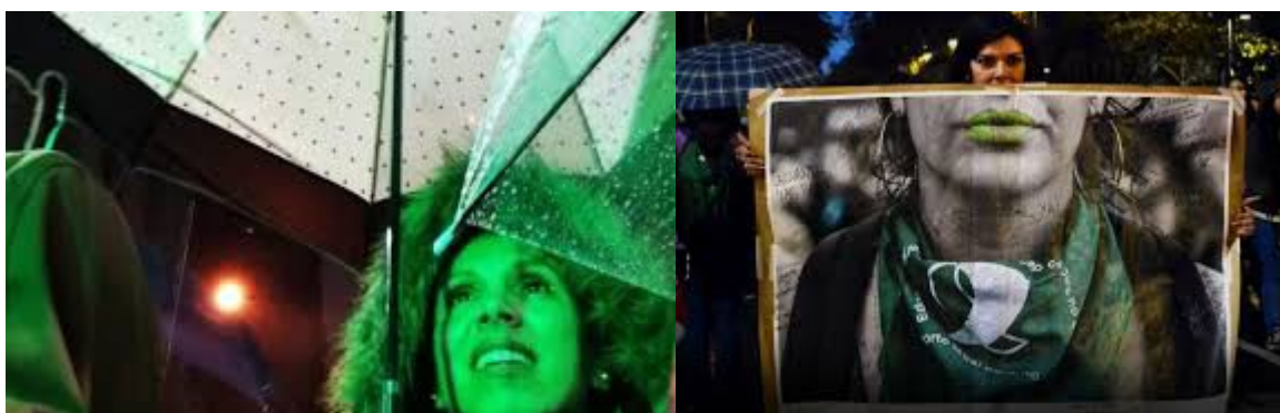
Fotogalería, perfil.com 2