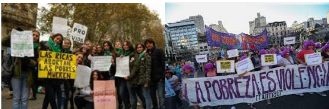
página 12.com 3

Lo dicho, pero no presente, estaba en el cuerpo vulnerado de las mujeres que morían, o que mueren, en abortos clandestinos, que es una forma de femicidio estatal por ausencia de leyes, pero además, porque el Estado está condenando a mayor cantidad de gente a la pobreza y estas mujeres se ven obligadas, cuando no quieren un embarazo a recurrir a abortos clandestinos con el resultado que ya todos conocemos. Esto estuvo presente en la cartelera, por ejemplo, en Página 12 hay una foto que dice el número de mujeres que han muerto por abortos clandestinos, la denuncia de que la pobreza es violencia estuvo presente y, también, carteles donde las chicas, sobre todo las jóvenes, están denunciando que no quieren ser obligadas a maternar.