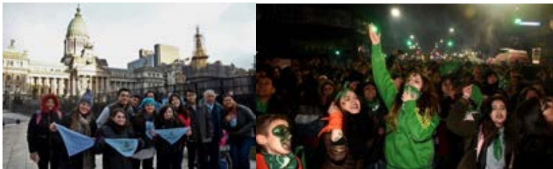
Fotogalerías, clarin.com e infobae.com

En el fotoperiodismo es donde mejor se ve; de la misma forma que en el caso de la semantización, lo vamos a ver o por plano detalle o por construcción en la política del encuadre o por edición: la foto que equipara celestes y verdes con el Congreso espejado, por ejemplo.