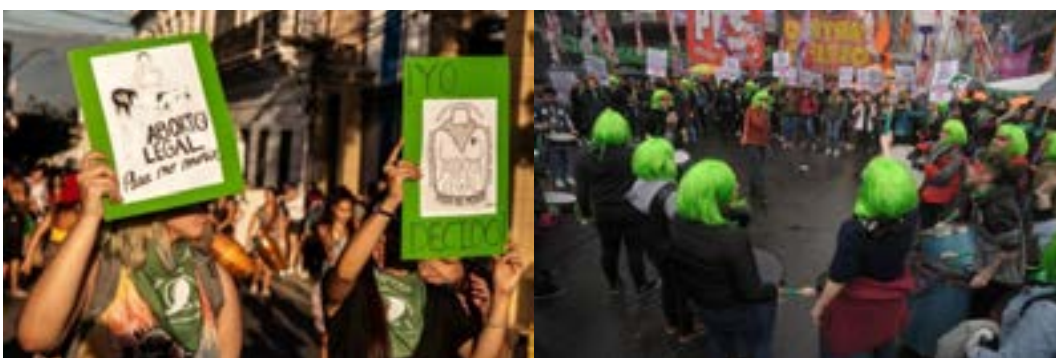
Fotogalerías de clarin.com y perfil.com

Y después, lo que es re interesante es el paso de víctimas a guerreras: la pintura, es la pintura de guerrera; no es el maquillaje con el que salimos a bailar, sino que es el maquillaje del guerrero; mujeres pintándose frente al espejo, pero pintándose como guerreras, un gesto femenino resignificado.