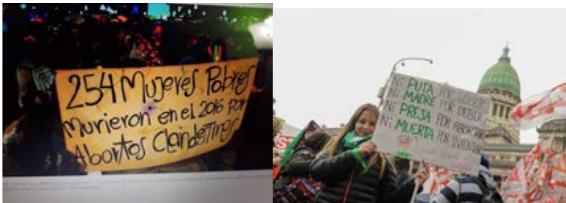
página 12.com y clarín.com

El cuerpo femenino está ausente. Es una ausencia espectral. En una foto que está tomada de una performance un cartel dice "Pobre porque desde la tumba no se puede hablar".