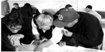
Encuentro con los vecinos del Centro Comunitario del barrio 8 de Mayo.

Mapas e infografías sobre el trabajo y la vida cotidiana de las zonas afectadas por el Complejo Ambiental Norte III del CEAMSE, en el partido bonaerense de General San Martín.