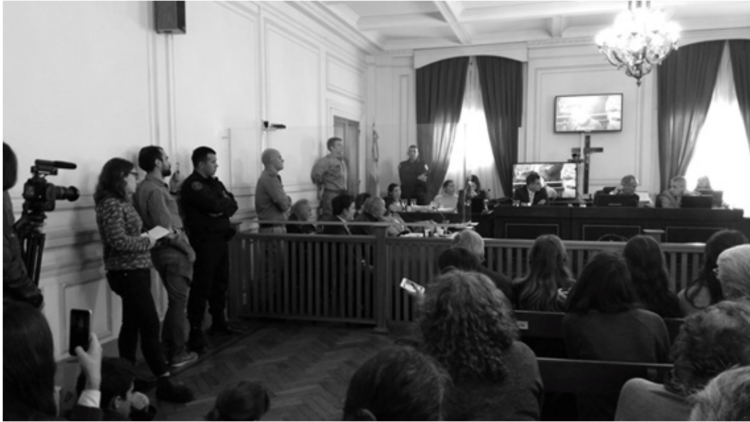
2. Primera audiencia del juicio contra la CNU de La Plata el 15 de mayo de 2017. A la izquierda se encuentran los acusados y sus abogados, detrás de una mampara de vidrio. Detrás del tribunal se ve un enorme crucifijo que fue retirado a pedido de las querellas.