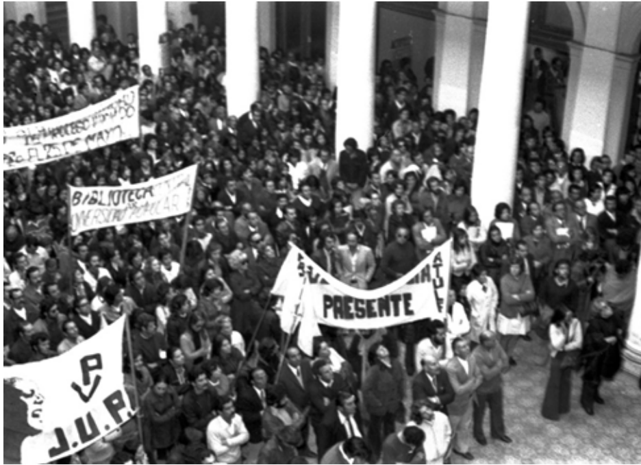
25. Acto de ATULP, JUP y ATDUNLP a cargo de autoridades administrativas, 23 de abril de 1974. AR-AH-UNLP. Argentina, Archivo Histórico de la Universidad Nacional de La Plata, Secretaría de Asuntos Académicos, Presidencia, UNLP. Fondo Presidencia UNLP. Sección Prensa. Serie Fotografías institucionales.