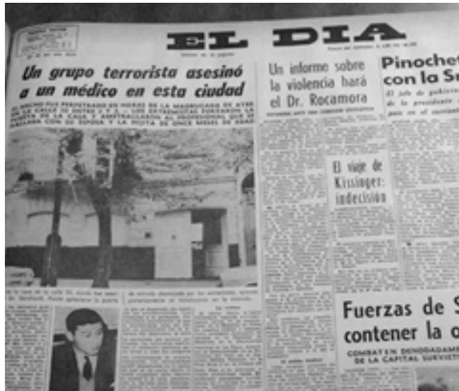
12. Tapa del diario El Día tras el asesinato del reconocido médico pediatra Mario Gershanik, en su edición del 11 de abril de 1975.