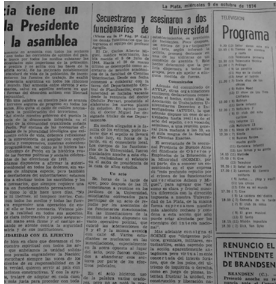
10. Nota interior de esa misma edición (fotografía 9) sobre el secuestro y asesinato de ambos dirigentes.