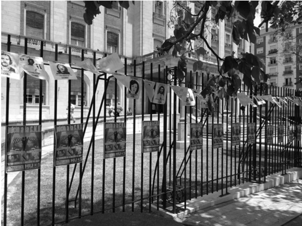
4. Fotografías de las víctimas de la CNU colocadas en las rejas del Tribunal Federal de La Plata. Más abajo en las rejas, fotos de los dos acusados. Recopiladas por la asociación HIJOS.