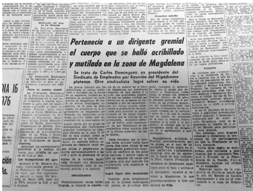
16. Nota interior del diario El Día tras el asesinato del dirigente de trabajadores del hipódromo platense Carlos Domínguez, en su edición del 14 de febrero de 1976.