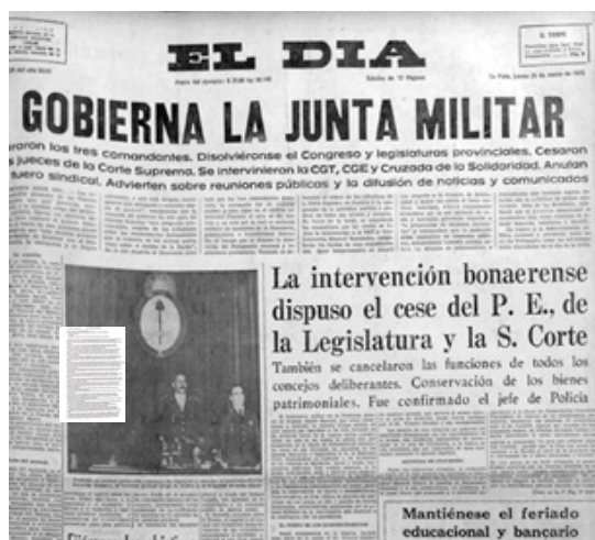
20. Portada del diario El Día del 25 de marzo de 1976, al día siguiente del golpe de Estado cívico-militar.

4 DCJ76 PAR 0236 LAW | EMI 130105-18h05 w0708