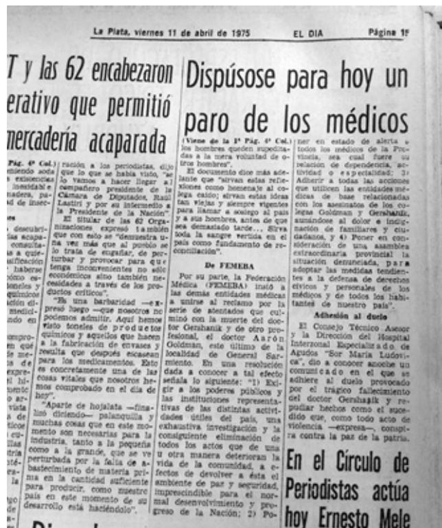
13. Nota interior de esa misma edición (fotografía 12) sobre el asesinato de Gershanik.